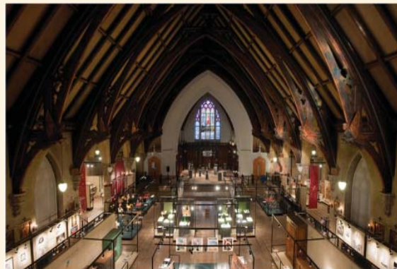
Intérieur du Musée des maîtres et artisans du Québec