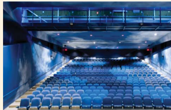
Salle Émile-Legault

La valeur sociale du Cégep de Saint-Laurent repose sur :