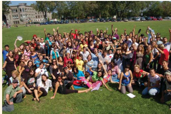
Etudiants sur la plaine gazonnée devant le pavillon E