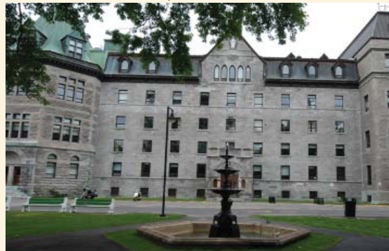
Fontaine dans le parterre devant le pavillon B