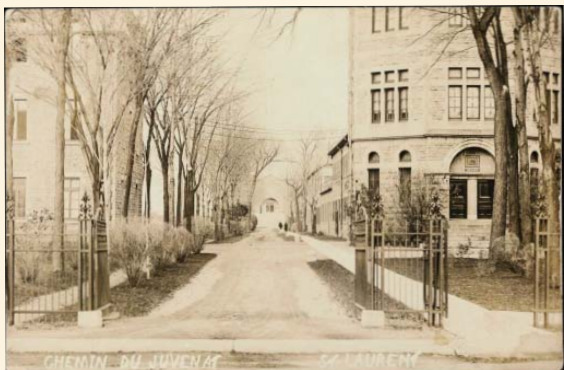
Perspective dans l'axe de l'allée du Juvénat (années 1920)

La valeur historique du Cégep de Saint-Laurent repose sur son témoignage :