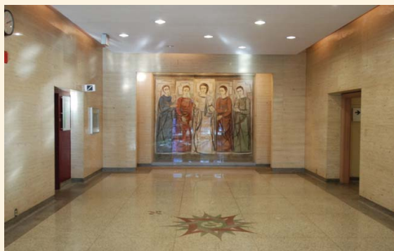
Hal d'entrée et peinture de Stanley Cosgrove (pavillon C)

La valeur architecturale et artistique du Cégep de Saint-Laurent repose sur :