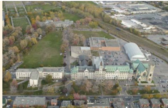
Vue à vol d'oiseau du campus du Cégep de Saint-Laurent