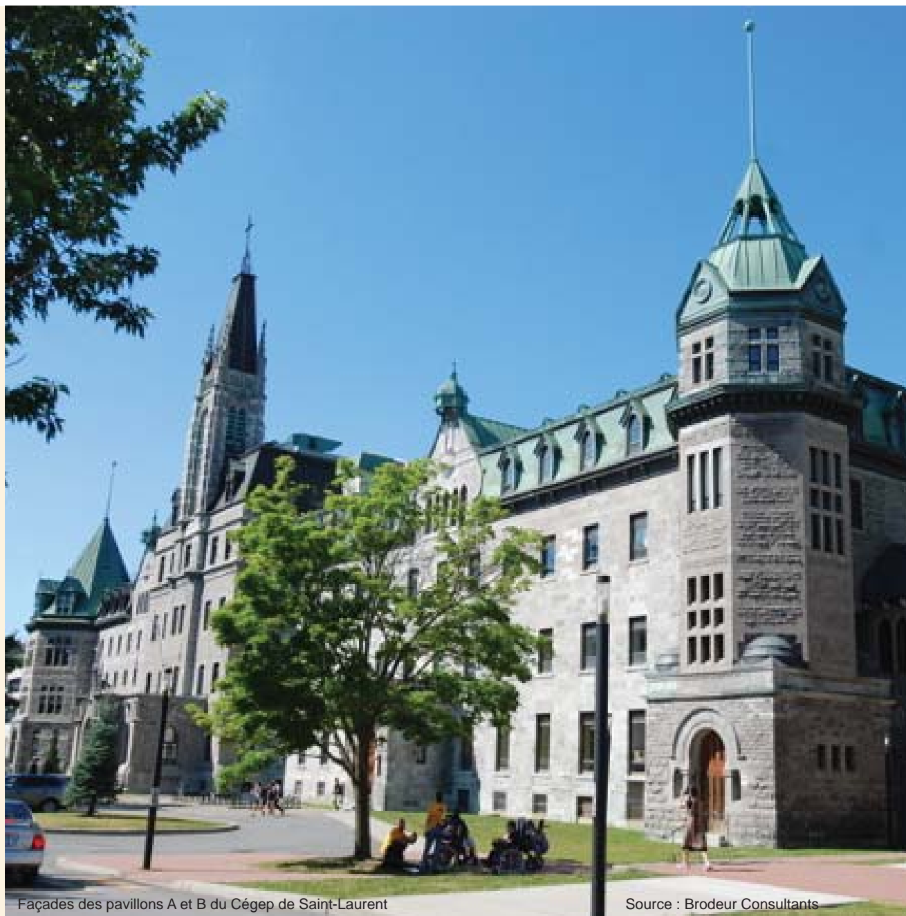
Façades des pavillons A et B du Cégep de Saint-Laurent

Enfin, le Cégep est un lieu d'enseignement et de vie sociale dynamique, à la fois intégré au territoire montréalais et en retrait de la ville. Il participe à la vie culturelle de la métropole par la présence du Musée des maîtres et artisans du Québec et de la salle de spectacle Émile-Legault.