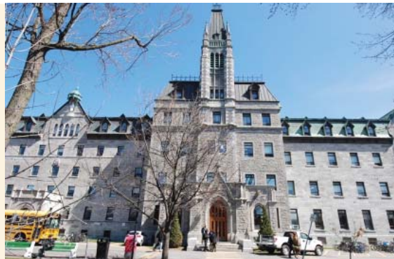
Façade des pavillons A et B