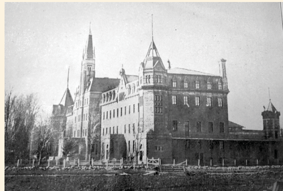
Vue du collège après 1916