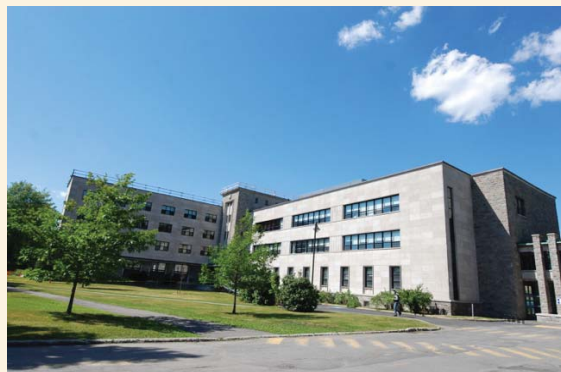
Pavillon Jean-Pierre-Castonguay (pavillon C)