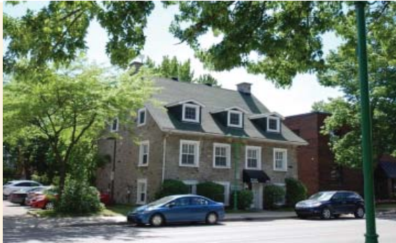
Ancienne maison Lavoie (pavillon H)