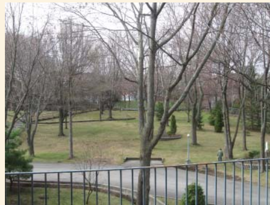
La cour arrière fermée à son environnement urbain, en lien intime avec l'intérieur des bâtiments.