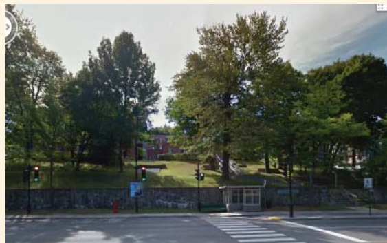
La façade de l'ensemble conventuel en surplomb du chemin de la Côte-Sainte-Catherine.