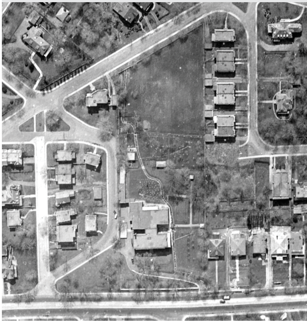
La propriété des Soeurs Missionnaires de l'Immaculée-Conception vers 1947. La partie sud du terrain, auparavant cultivée, sera éventuellement plantée de nombreux arbres.

1 Les cahiers d'évaluation du patrimoine urbain ont été réalisés en 2003-2004 par le Service de la mise en valeur du territoire et du patrimoine dans le cadre de la préparation du Plan d'urbanisme 2004