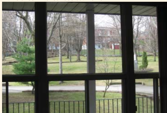
Une vue sur la cour depuis un salon communautaire.

La valeur PAYSAGÈRE du site de la maison mère des Soeurs M.I.C. repose sur :