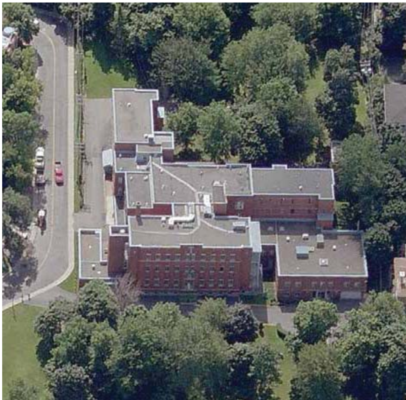
L'ensemble conventuel des Soeurs Missionnaires de l'Immaculée-Conception avec, au premier plan, le pavillon central érigé en 1939.

Enfin, la valeur architecturale de ce site repose essentiellement sur la présence prédominante en façade du pavillon central, dont la composition classique, symétrique et finement articulée, se démarque de l'ensemble construit.