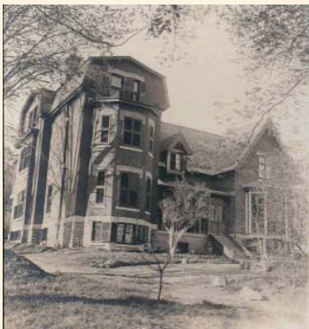
L'occupation du site par les Soeurs M.I.C. remonte à 1906 lors de l'achat de la propriété Languedoc.