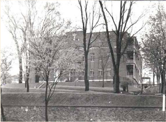
Le pavillon central (construit en 1939) en 1944. L'entrée au site se fait alors via un chemin d'accès, aujourd'hui disparu, qui débute au chemin de la Côte-Sainte-Catherine.