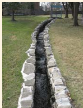
Le ruisseau témoigne du paysage de la montagne sur lequel la ville s'est construite.

La valeur HISTORIQUE du site de la maison mère des Soeurs M.I.C. repose sur :