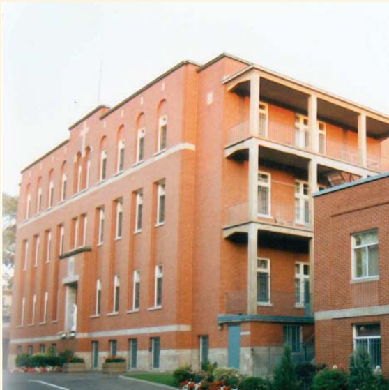
Le pavillon central, aujourd'hui, qui a été amputé de son entrée principale.

La valeur ARCHITECTURALE du site de la maison mère des Soeurs M.I.C. repose sur :