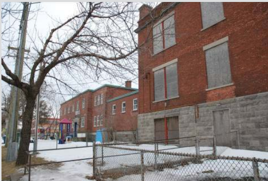
L'académie Bélair (droite), l'ancienne résidence des religieuses et l'actuelle école Saint-Bernardin (Ville de Montréal, février 2013)

La valeur paysagère urbaine du site de l'académie Bélair repose sur :