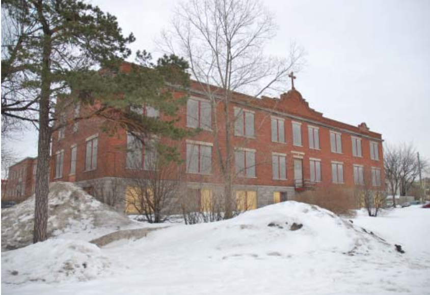
Académie Bélair, 2950, rue Jarry Est