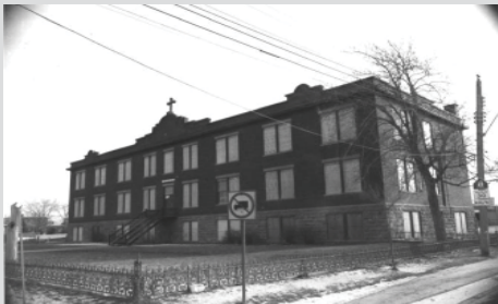
L'école Saint-Bernardin en 1983, 2650, rue Jarry Est