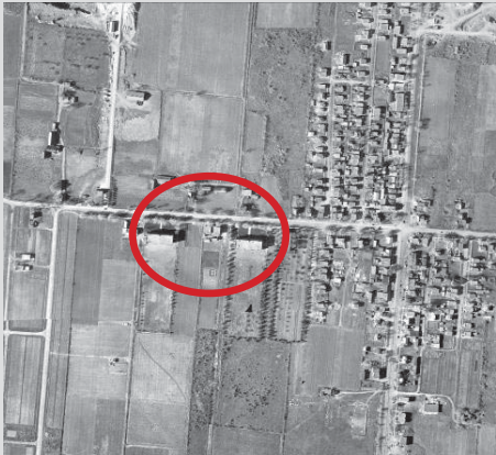
Le noyau villageois de Saint-Michel en 1947 et les deux écoles jumelles