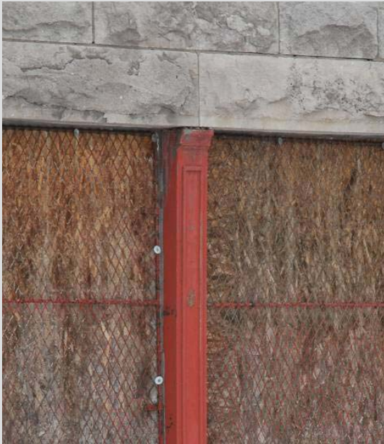
Un des trumeaux ornant les fenêtres du bâtiment

La valeur architecturale de l'académie Bélair repose sur :