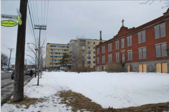
L'académie Bélair et le Centre d'hébergement Saint-Michel (Ville de Montréal, février 2013)