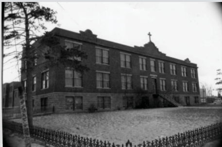
L'académie Bélair en 1983, 2950, rue Jarry Est (source : Ville de Montréal)

La valeur historique du site de l'académie Bélair repose sur :