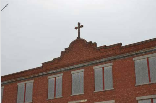
Le fronton surmontée d'une croix de la façade principale