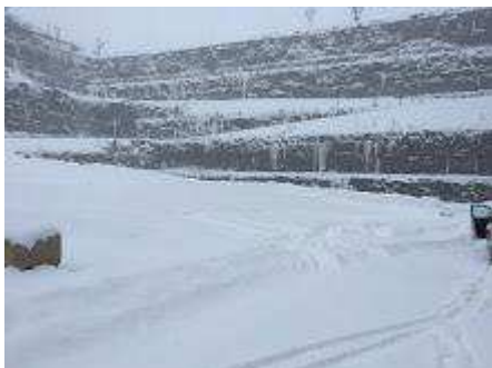
Cellule 3.JPG 1984K