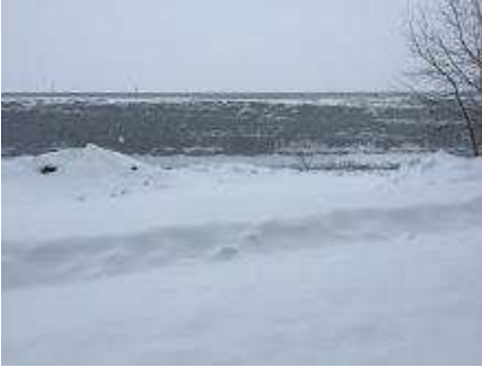
Chemin d'accès vers cellule 1.JPG 1554K