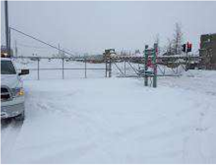
Barrière manuelle - Entrée du LET.JPG 1556K