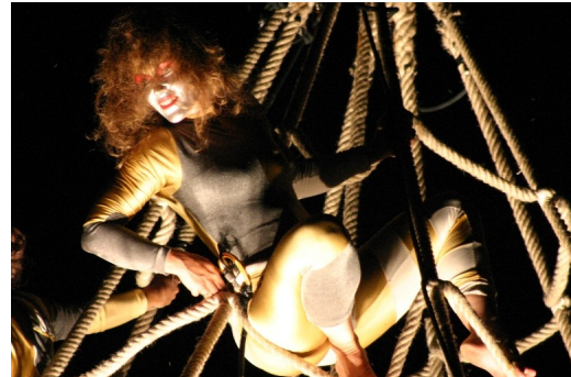
Festival de théâtre de rue

Je serais injuste en essayant de nommer les différents événements culturels que j'ai vus parce que plusieurs vont rester dehors la liste. Mais, je dois parler de deux plus fortes impressions que me laisse l'offre culturelle à Lachine. Les activités sont un véhicule extraordinaire d'intégration de la communauté, spécialement des nouveaux arrivants qui peuvent comprendre la culture et les habitudes des gens qui les accueillent. D'autre part, j'ai participé à l'exposition de peintures de L'atelier de peinture de Lachine dans le cadre des Journées de la culture et vingt-cinq artistes ont participé à l'événement en présentant plus de quatre-vingts tableaux. Étonnant pour moi, parce que tous les artistes étaient lachinois; à lui seul l' Atelier de peinture réunit plus de quarante artistes peintres lachinois et il y a d'autres organisations. Ces deux impressions : l'intégration à travers de la culture et la quantité d'artistes montrent la force et la qualité du quartier culturel du Vieux-Lachine.