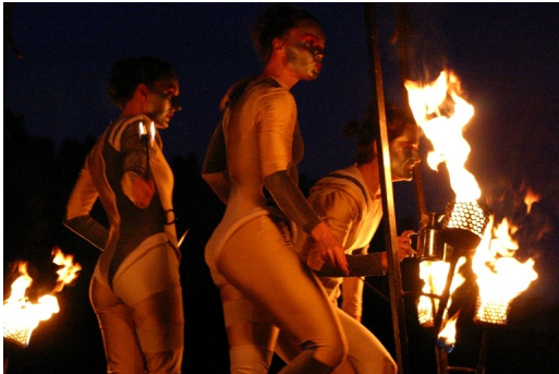
Festival de théâtre de rue

bibliothèques municipales et à la salle de L'Entrepôt située dans le Complexe culturel Guy-Descary, un magnifique centre culturel avec une salle d'expositions, une salle de spectacles, le musée permanent de l'histoire de la bière, l'école de danse et l'atelier de peinture.