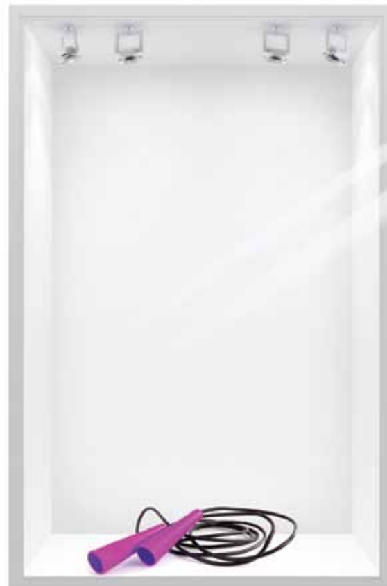
CORDE À SAUTER Jouet

Le niveau d'activité physique d'un enfant a des effets directs sur la santé mentale et le poids corporel; en retour, ces effets peuvent avoir des conséquences sur les niveaux globaux d'activité physique d'un enfant.