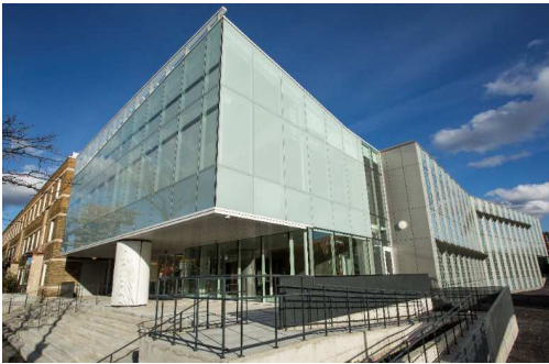
Bibliothèque Marc-Favreau (2013) Arrondissement de Rosemont–La Petite-Patrie