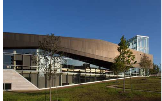
Bibliothèque du Boisé (2013) Arrondissement de Saint-Laurent