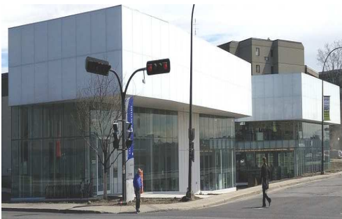
Bibliothèque Saul-Bellow (2015) Arrondissement de Lachine