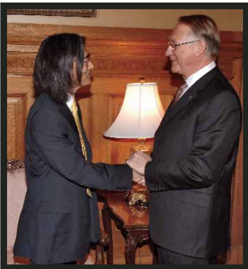
Kent Nagano reçoit le certificat de citoyen d'honneur de la Ville de Montréal