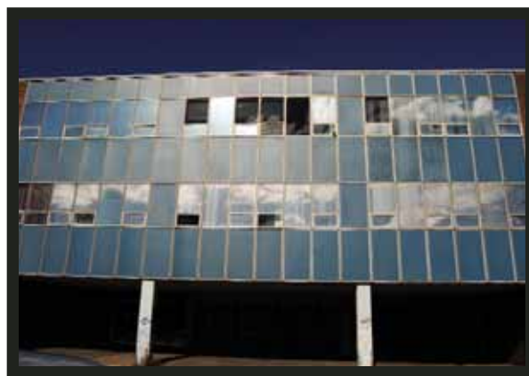
Le Chat des artistes, projets d'ateliers dans l'arrondissement de Ville-Marie © Marie-Anne Marchand