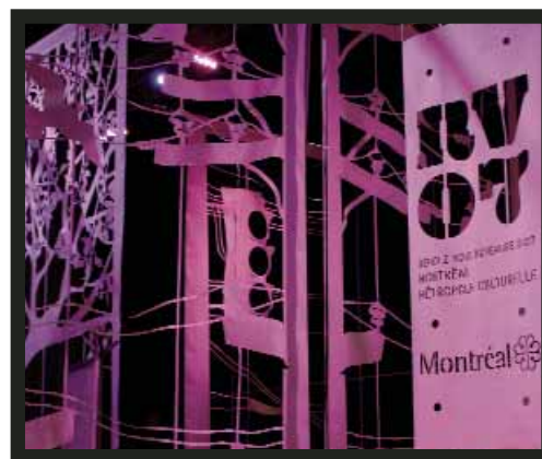
Place du RV07