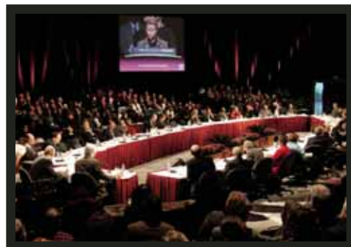
Salle des interventions, Rendez-vous novembre 2007 – Montréal, métropole culturelle

La Plan d'action 2007-2017 – Montréal, métropole culturelle peut être consulté depuis le site Internet des cinq partenaires à l'adresse : montrealmetropoleculturelle.org