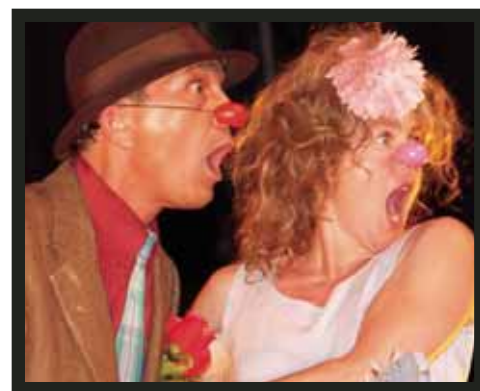
Terre Aphasique, spectacle Les clowns, Théâtre Aphasique, Prix Paul-Buissonneau 2007