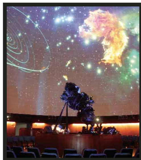
Théâtre des étoiles et planétaire Zeiss