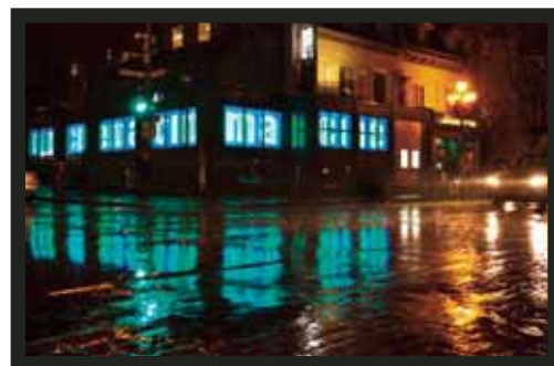
Illumination de l'ONF dans le cadre du Plan lumière mise en œuvre par le Partenariat du Quartier des spectacles