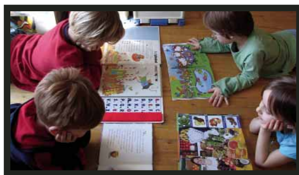
Enfants lisant dans une bibliothèque de la Ville de Montréal