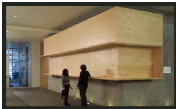
Alexandre David, Sans titre , 2007, Contreplaqué verni, armature de bois avec plaques d'acier. Prix Louis-Comtois. Collection municipale d'œuvres d'art © Alexandre David