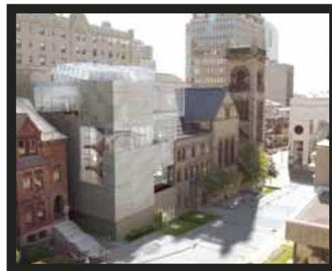
Vision du futur pavillon d'art canadien Claire et Marc Bourgie du Musée des beaux-arts de Montréal dans l'église Erskine & American © Musée des beaux-arts de Montréal