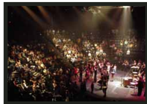
Vue d'ensemble de la salle de spectacle de la TOHU, La Cité des arts du cirque