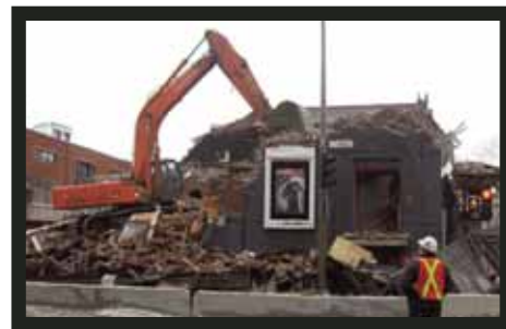
Démolition du Théâtre de Quart'sous avant reconstruction, février 2008

En 2007, le Pavillon de l'Arsenal de Paris a présenté l'exposition itinérante Concours d'architecture et imaginaire territorial – Les projets culturels au Québec 1991 – 2005 . Cet événement, produit par le Centre de design de l'Université du Québec de Montréal en collaboration avec le Laboratoire d'Étude de l'Architecture Potentielle (LEAP) de la Faculté de l'aménagement de l'Université de Montréal, exposait le travail d'une centaine d'architectes qui ont participé à 31 concours d'architecture lancés au Québec de 1991 à 2005. Sept de ces concours sont tenus à Montréal soit : la Bibliothèque d'Outremont, la rénovation et l'agrandissement du Centre national d'archives, la Grande Bibliothèque du Québec, l'École nationale de cirque, l'identification extérieure de la Place des arts, le chapiteau de la TOHU, La Cité des arts du cirque et l'Orchestre Symphonique de Montréal.