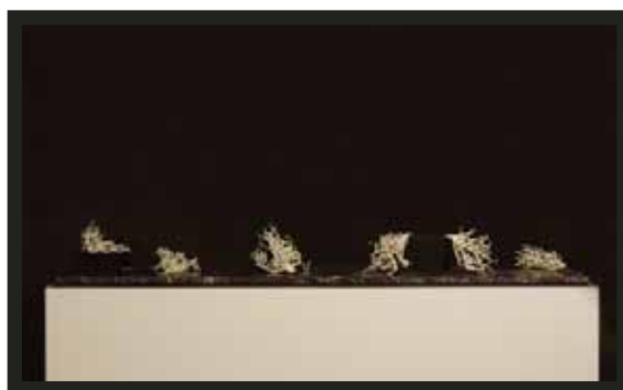
Patrick Coutu, Schémas , 2007, Composition de six éléments en porcelaine. Prix Pierre-Ayot 2007. Collection municipale d'œuvres d'art © Patrick Coutu