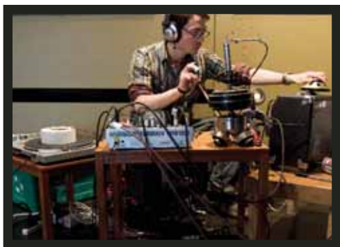
Dérappage invité c'Alpha_Elektra, Usine C, mai 2007