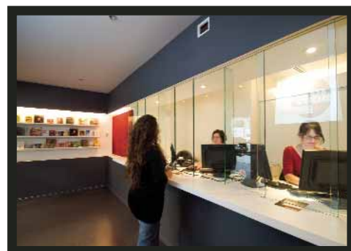
Billetterie de la Vitrine Culturelle