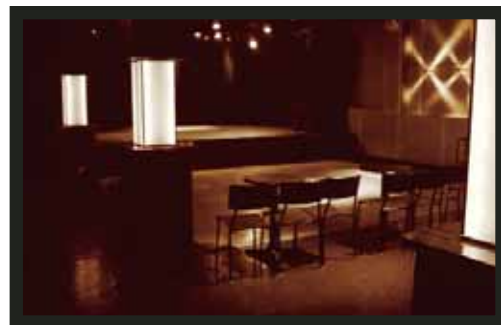
Salle de spectacle du Petit Campus