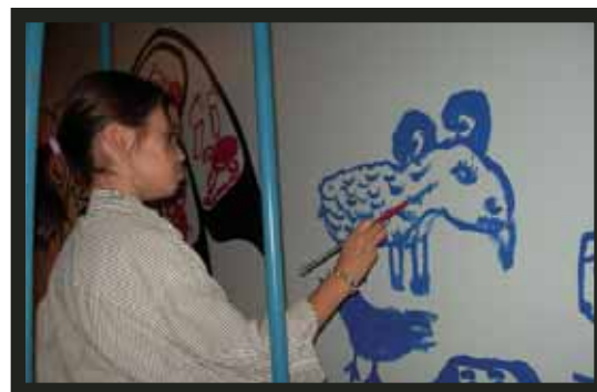
Enfant participant à l'atelier Nia, notre monde réalisé dans le cadre du Programme de médiation culturelle

Ce Programme offre des activités culturelles conçues pour les groupes scolaires en collaboration avec les organismes culturels et plusieurs arrondissements. De plus, son responsable au ministère de l'Éducation, du Loisir et du Sport se joint régulièrement à la Ville pour le développement d'une expertise et d'expériences réussies en matière de médiation culturelle. Il a aussi participé au comité organisateur des Rencontres sur la médiation culturelle , en plus de faire une présentation lors de cet événement.