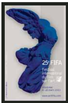
Affiche, Première édition du Festival Transamériques Affiche, 25 e édition du Festival International du Film sur l'art