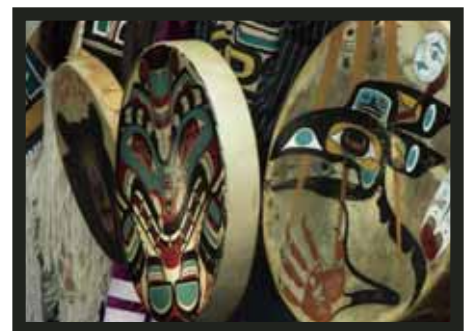
Célébrations entourant la remise en place du Mat totémique Kwakiutl, septembre 2007