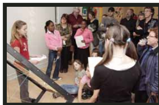
Élèves ayant participé au projet de résidence d'artistes à l'école. Réalisé dans le cadre du Programme de médiation culturelle