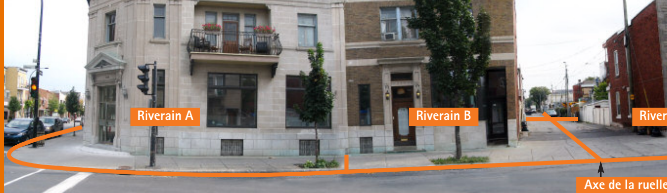
(Rue Villaray, entre les rues Saint-Hubert et Chateaubriand)

RENDRE PLUS COHÉRENTE ET EFFICACE L'APPLICATION RÉGLEMENTAIRE