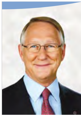
Gérald Tremblay Maire de Montréal Mayor of Montréal