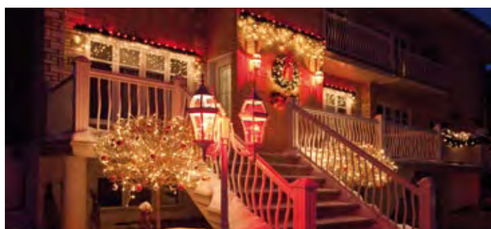
Gagnant 2009 Winner

Laissez libre cours à votre audace et à votre imagination et courez la chance de gagner le concours Magie des Fêtes.