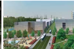
QUARTIER DE LA FALAISE ET TRAMWAY VERS LASALLE