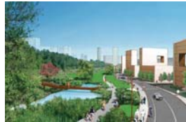
PARC DE LA FALAISE

Over and above the circular-shaped main interchange, the project also provides for completely redeveloping Turcot yard, between the Lachine Canal and the Saint-Jacques escarpment, at the outer limits of LaSalle. Thanks to the representations made by your elected officials during the various working meetings and within the public hearings, Montréal's project features practically all of our borough's requests and includes a number of aspects that would have a positive impact on LaSalle residents.