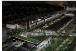
GARE ET VIADUC IRWIN