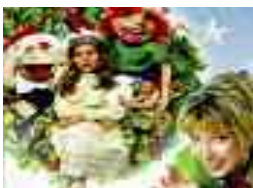
Pour les 5 à 12 ans

Cinq clowns dans une même famille et chacun d'entre eux rivalise avec dérision et insistance pour prendre la place qui lui revient. Tentatives chorégraphiques et équilibres précaires deviennent prétextes à des prouesses plus farfelues. Une touche de modernité et de douce fantaisie pour le plaisir des grands comme des petits.