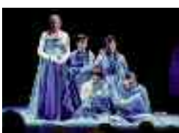
Pour les 18 mois et plus