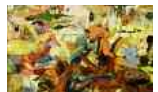
Travailler sous pression