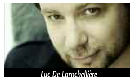
Luc De Larochellière

Un artiste au sommet de son art. Son dernier album a été applaudi unanimement par le public et la critique. Spectacle vibrant où l'artiste mêle une musique aux sonorités subtiles à des textes d'une grande maturité pour nous livrer ses sentiments et ses états d'âme avec brio. Luc De Larochellière comme vous ne l'avez jamais vu sur scène auparavant!