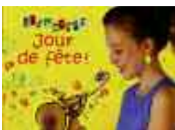
Pour les 4 à 8 ans

Sur le terrain de soccer, les jumeaux s'affrontent. Fou-Fou voudrait bien être un champion, mais le ballon court après lui! Coco, elle, joueuse très douée, marque buts sur buts, tout comme son papa un ancien joueur professionnel... Qui gagnera cette partie loufoque et hallucinante?