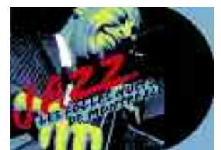
Histoire du Jazz