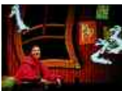
Pour les 3 à 6 ans

On est presque à la grande nuit de Noël et Virus n'a pas encore envoyé sa longue liste au père Noël! Lili est découragée. Comment lui faire comprendre que cette liste interminable, ce n'est pas ça l'esprit de Noël? Et il y a Chop-suey qui a peur du père Noël et la Fée des étoiles qui dévoile un secret!