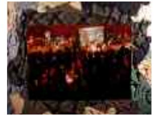
10 ans d'urgence - ATSA

Ce projet scrute nos modes de domestication du paysages en recréant des espaces singuliers : aire de pique-nique, vieux puits, etc. Ces saynètes incitent à l'expérience sensible de l'objet porteur d'identité culturelle.