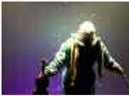
Pour les 4 à 8 ans

Billets : 4 $ enfant/6 $ adulte 514 367-5000 Les spectacles durent de 50 à 60 minutes