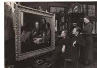
Le faussaire de Vermeer