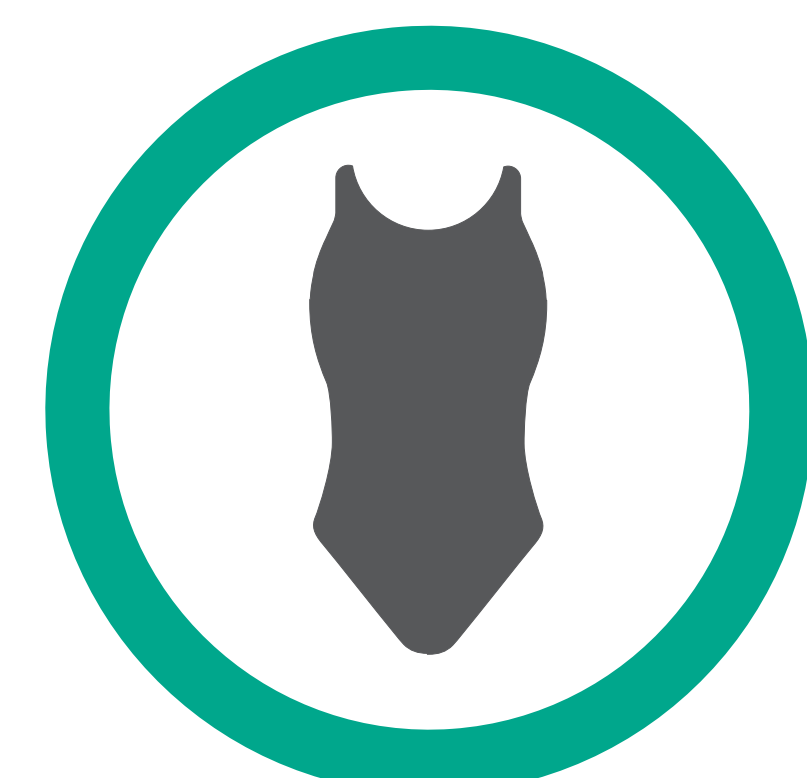
Maillot de bain