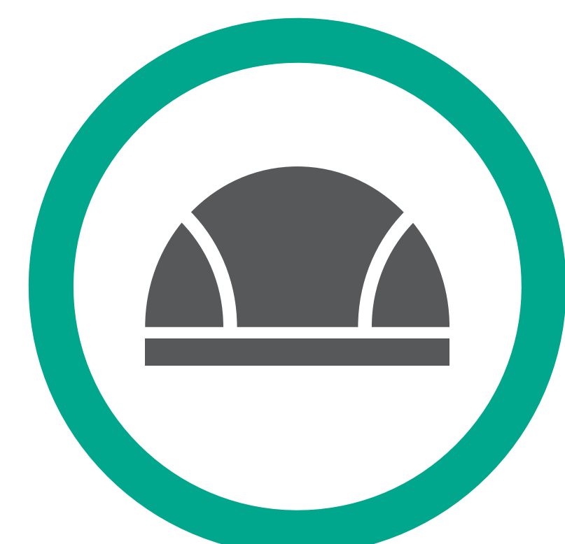
Casque de bain