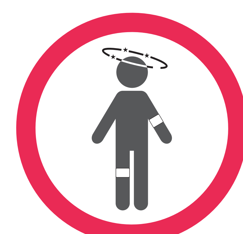
Ne pas se baigner si l'on est malade