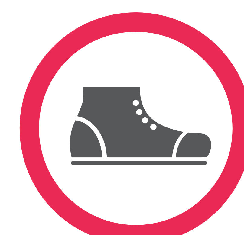
Bottes et souliers