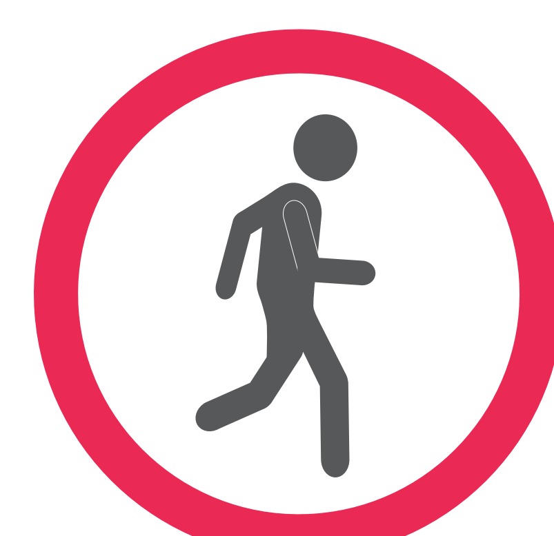
Ne pas courir