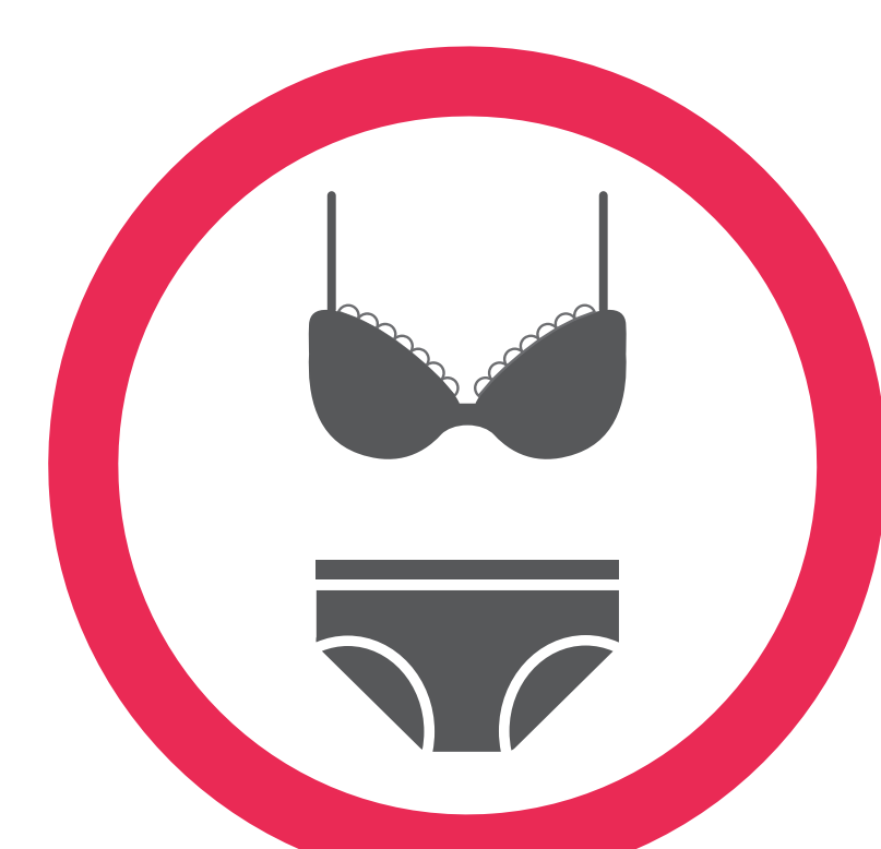
Ne pas se baigner avec des sous-vêtements