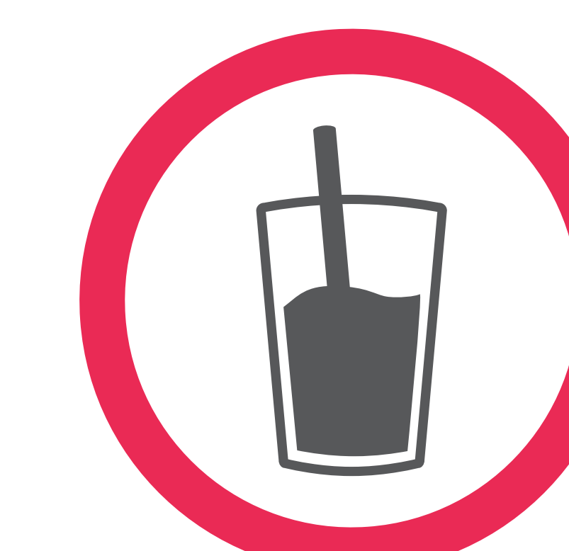
Contenants en verre