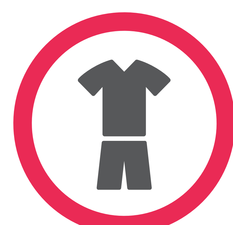
Ne pas se baigner avec des vêtements