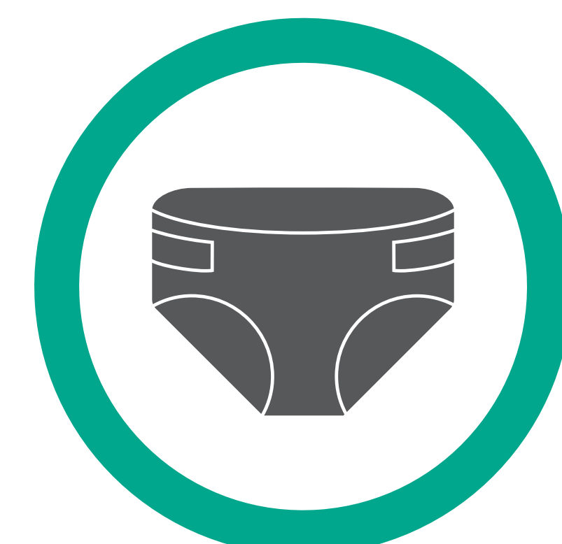
Couche pour piscine seulement