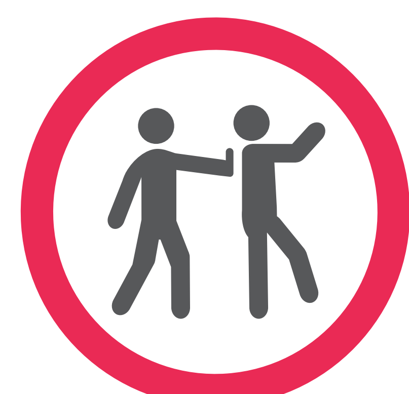
Ne pas se bousculer