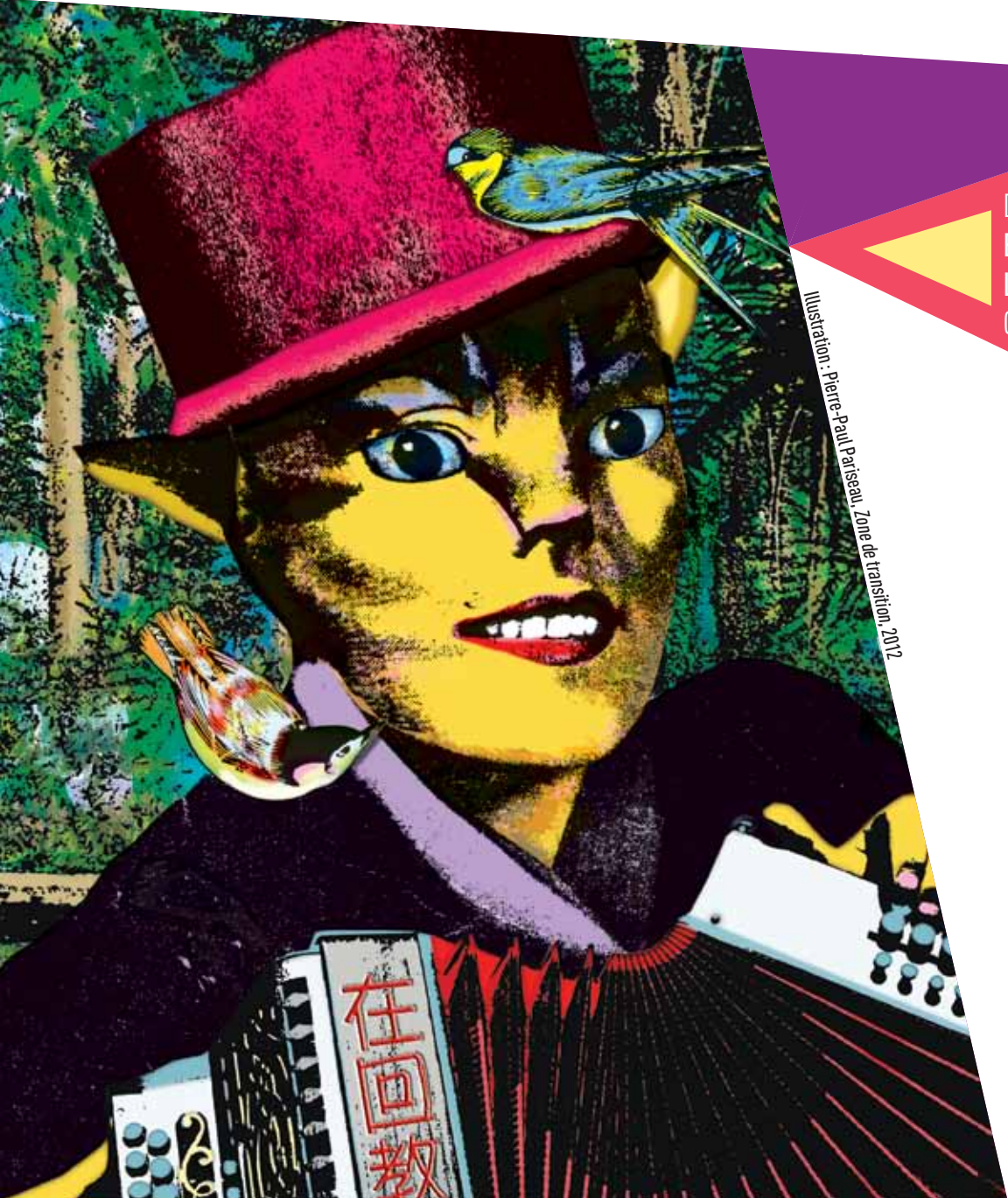
Illustration: Pierre-Paul Pariseau, "Zone de transition", 2012

Du 2 juillet au 31 août – Salle de diffusion de Parc-Extension Exposition La métamorphose des apparences Œuvres de Pierre-Paul Pariseau