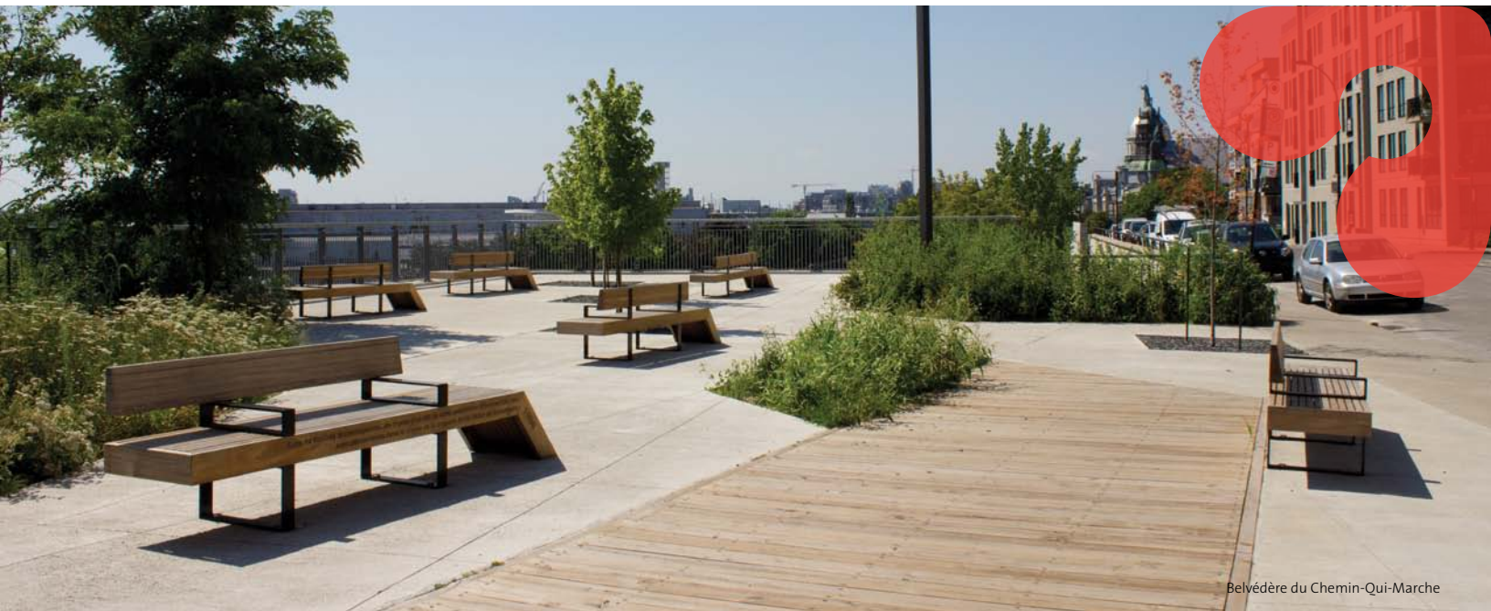
Belvédère du Chemin-Qui-Marche