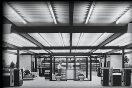
Chicago History Museum, HB-32709e2, Hedrich Blessing

Abritant aujourd'hui un centre où deux générations se rencontrent, le lieu préserve le caractère authentique de son illustre concepteur.