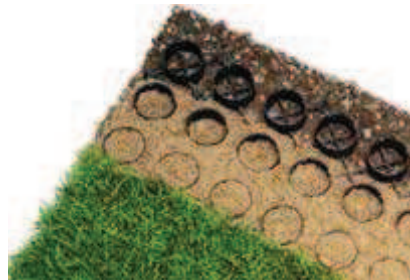
Pavés végétaux