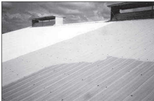
Enduit réfléchissant pour toit.

Source : http://www.omafr.gov.on.ca (Janvier 2008)