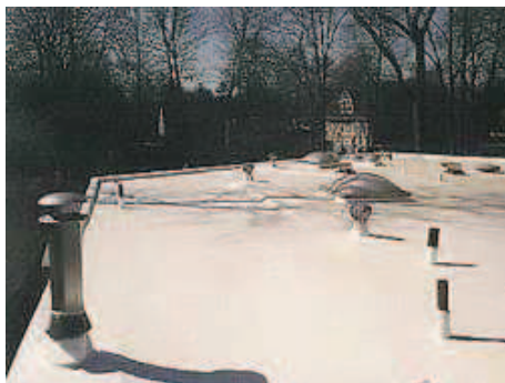
Membrane polyurée

Il représente un excellent scellant, très résistant au poids et aux intempéries. C'est un matériau qui existe depuis longtemps. Il aide à réduire la consommation d'énergie et permet de sceller des fissures. Son application peut se faire en tout temps de l'année, rapidement, sur un toit plat ou en pente. On l'applique par pulvérisation (rapide et facile d'installation), sans flamme, contrairement aux toitures conventionnelles en bitume, ce qui réduit le risque d'incendie.