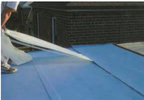
Membrane élastomère.

La membrane élastomère est préfabriquée à base de bitume élastomère, avec une armature intérieure et une surface granulée. Ce produit est disponible en plusieurs couleurs pâles qui augmentent la réflectivité des rayons solaires. Cette membrane est de fabrication très résistante, elle offre une longue durabilité (environ 30 ans) et est sans odeur. Son installation est rapide et la membrane élastomère autocollante permet aussi une installation sans flamme. Bien qu'elle soit environ 15 % plus coûteuse qu'une membrane conventionnelle, elle représente un très bon investissement à long terme.