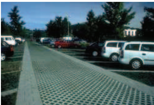
Pavés Grasscrete

Les pavés alvéolés sont des dalles composées d'alvéoles de ciment à l'intérieur desquelles l'herbe peut pousser. Ils ont une capacité de charge très importante.