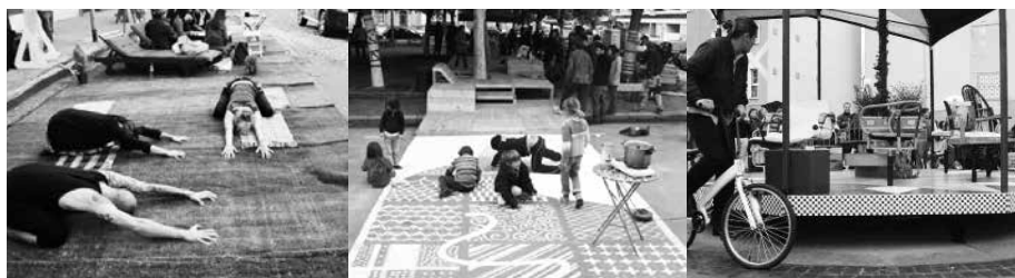
Ambiance et types d'activités proposés.