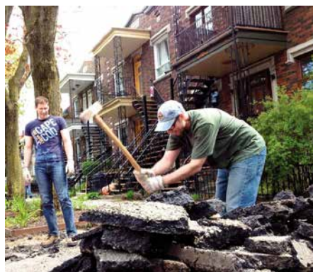
Malgré le travail éreintant, les résidants ont la satisfaction de voir reverdir l'espace devant leur demeure.

Pour plus de détails : jefaismontreal.org