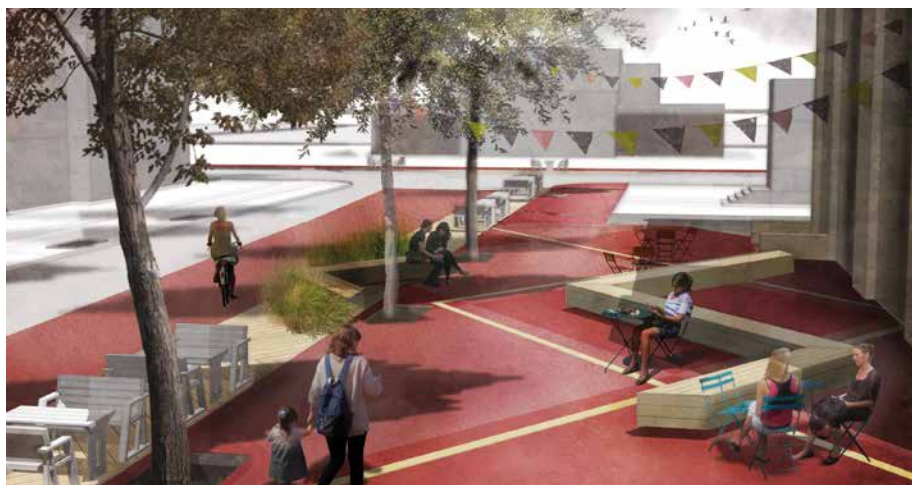
Le nouvel aménagement offre un espace de 580 m 2 ouvert aux initiatives spontanées de citoyens inspirés!

L'arrondissement souhaite offrir un lieu de détente et de divertissement où la créativité et la spontanéité seront de mise tous les jours. Fête de famille ou de voisins, pique-nique, cours de yoga en plein air et même tournoi d'échecs, les citoyens seront invités à faire preuve de créativité afin d'animer, au quotidien, ce nouvel espace. S'il y aura peu de limites imposées à l'imagination, les règles habituelles d'utilisation du domaine public devront être respectées, notamment le règlement sur les parcs.