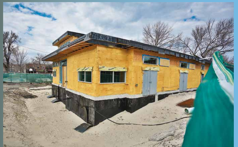
Voici le chalet du parc du Pélican, tel qu'on pouvait le voir au mois d'avril 2014.

Au parc De Gaspé, le chalet et la pa-taugeoire font depuis quelques mois l'objet d'une réfection majeure. Les travaux progressent très bien et les petits devraient pouvoir s'y tremper les orteils d'ici juillet.