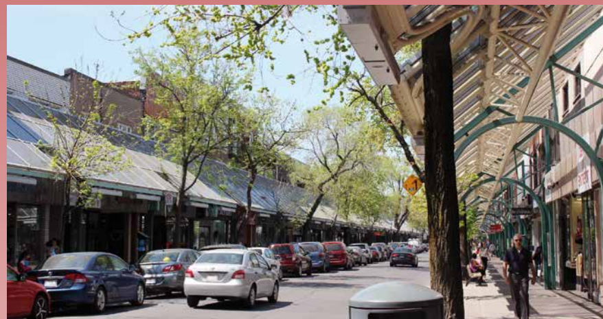
Le saviez-vous? Les 100 ans d'histoire de la Plaza en font l'une des plus anciennes artères commerciales de Montréal qui, fait intéressant, a vu naître le tout premier restaurant de la chaîne de pâtisseries St-Hubert.

Les travaux de réfection de la Plaza St-Hubert constituent une occasion unique de tester une approche novatrice de planification et de gestion de travaux d'infrastructures et d'aménagement urbain. C'est ainsi que l'arrondissement a pris la décision, avec l'appui de la communauté d'affaires locale, de mettre sur pied un projet pilote afin de tester le nouvel aménagement de la circulation. Ainsi, des correctifs pourront être apportés si nécessaires, et ce, avant la réalisation des grands travaux.