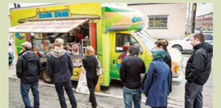
Jusqu'au 1 er octobre, la cuisine de rue fera le bonheur des résidents et des travailleurs.

Pour consulter l'horaire : ville.montreal.qc.ca/rpp