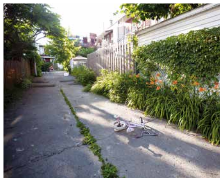
De plus en plus de ruelles s'embellissent dans l'arrondissement.