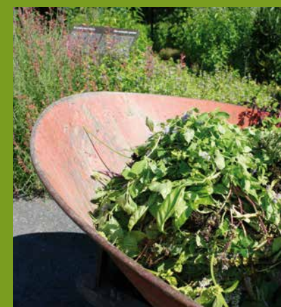
L'arrondissement ramasse les résidus verts.

La collecte a lieu tous les mercredis jusqu'au 11 juin, puis du 24 septembre au 29 octobre. À noter que les branches d'arbre ne sont pas ramassées lors de ces collectes, en raison de la lutte contre l'agrile du frêne. Il faut prendre rendez-vous en signalant le 311 pour le ramassage des branches.