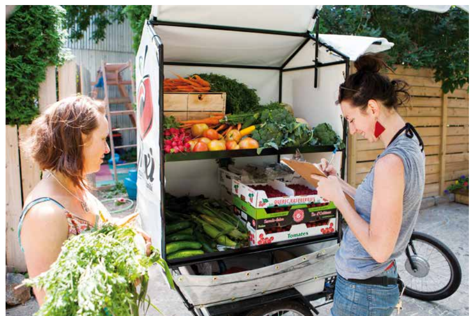
Cet été, ne manquez pas le vélo triporteur Fruixi qui se promène pour vendre des fruits et des légumes du Québec, dont certains sont cultivés à Rosemont.

Renseignements : 514 524-1797, poste 227