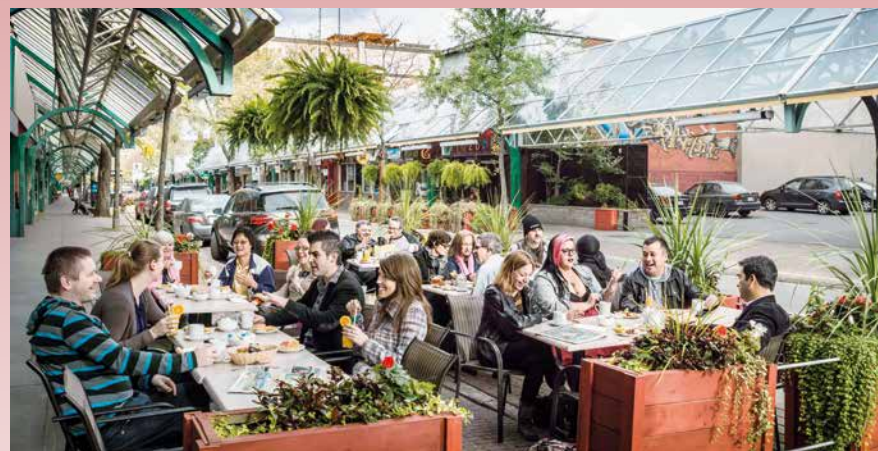
Ses 400 places d'affaires positionnent la Plaza au 3 e rang des artères commerciales les plus denses de Montréal et ses quelque 2,5 millions de visiteurs annuels en font l'une des plus populaires.