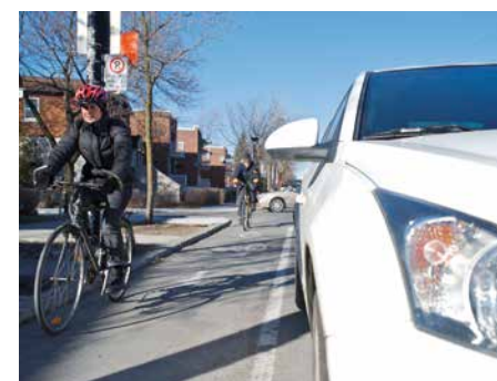
En vélo, en auto ou à pied, chacun a sa place et doit se sentir en sécurité.