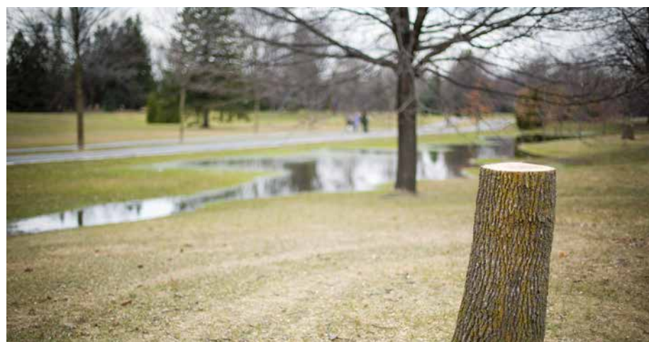
Soyez prévoyant, faites inspecter vos frênes.

Deuxième mise en garde : il est interdit de sortir des branches d'arbre de l'île de Montréal, quelle qu'en soit l'essence. Cette mesure préventive a incité l'arrondissement et la Ville à ne plus ramasser les branches d'arbre. Les résidents sont invités à téléphoner au 311 et une équipe ira sur place déchiquer les branches en copeaux.