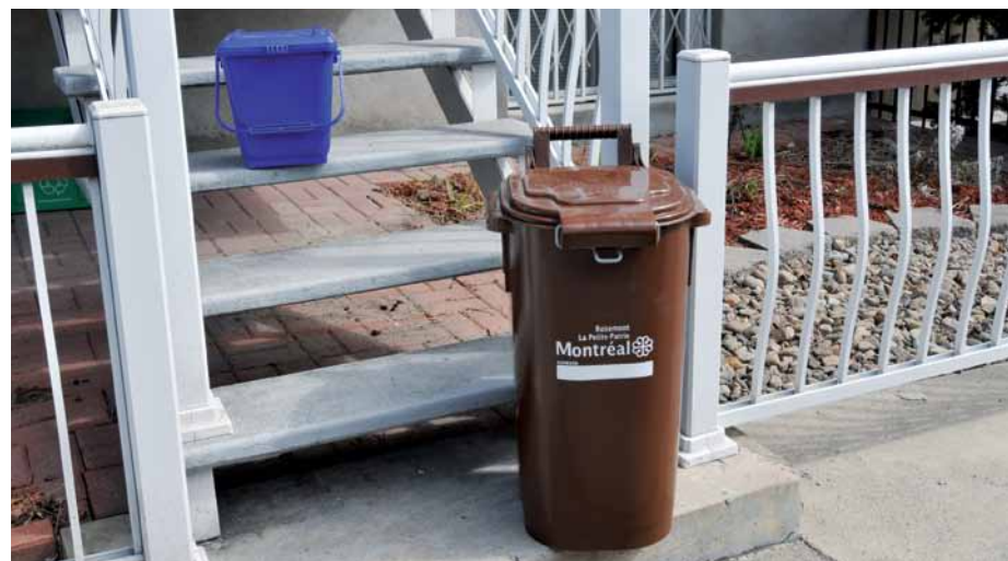
Chaque citoyen produit en moyenne plus de 600 kilos de résidus par année, dont 374 peuvent être recyclés.

L'arrondissement souhaite atteindre rapidement l'objectif québécois de réduire l'enfouissement de 60 %. La collecte des résidus alimentaires est un excellent moyen d'y parvenir étant donné que ces résidus représentent près de la moitié des matières récupérables qui se trouvent dans un sac à ordures. L'arrondissement doit attendre l'ouverture éventuelle de centres de compostage municipaux à Montréal pour être en mesure d'offrir ce service de collecte à tous les résidents du territoire.