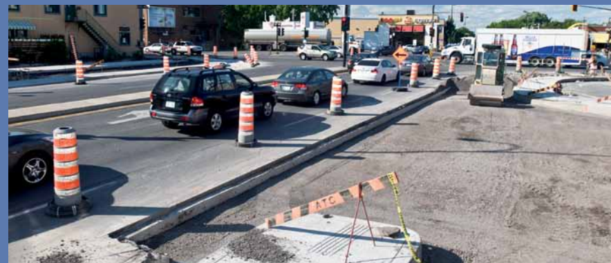
La Ville de Montréal a réaménagé cette intersection au cours de l'été, un investissement de 1,3 million de dollars.

Le projet comprenait également la reconstruction de trottoirs, de saillies, du mail central et d'un îlot, l'installation de mobilier d'éclairage et de feux de signalisation, la plantation d'arbres en bordure de la rue ainsi que l'ajout d'un feu de circulation à l'intersection des rues Masson et Molson. Le tout permet notamment de bien desservir le secteur résidentiel en construction sur la rue Molson, aux abords du parc du Pélican.