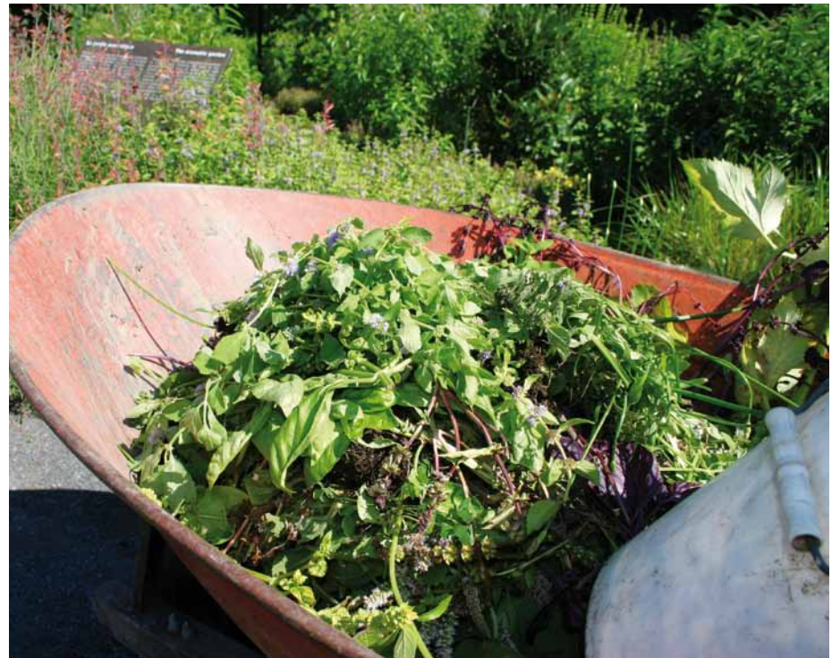
Nous ramassons tout ce qui vient de votre jardin, de votre cour ou de votre potager pour le composter.

Attention, les sacs de plastique verts ne sont pas acceptés, de même que les résidus alimentaires, les excréments d'animaux et les branches d'un diamètre de plus de 5 cm. Il est préférable d'utiliser des sacs de papier ou des boîtes de carton.