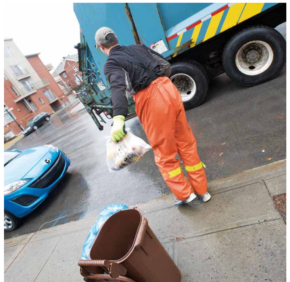
D'ici quelques années, les 70 000 résidences de l'arrondissement profiteront de la collecte des résidus alimentaires.

L'arrondissement fournit les bacs bruns à roulettes qui peuvent se ranger aisément à l'extérieur de la maison, de façon propre et hygiénique.