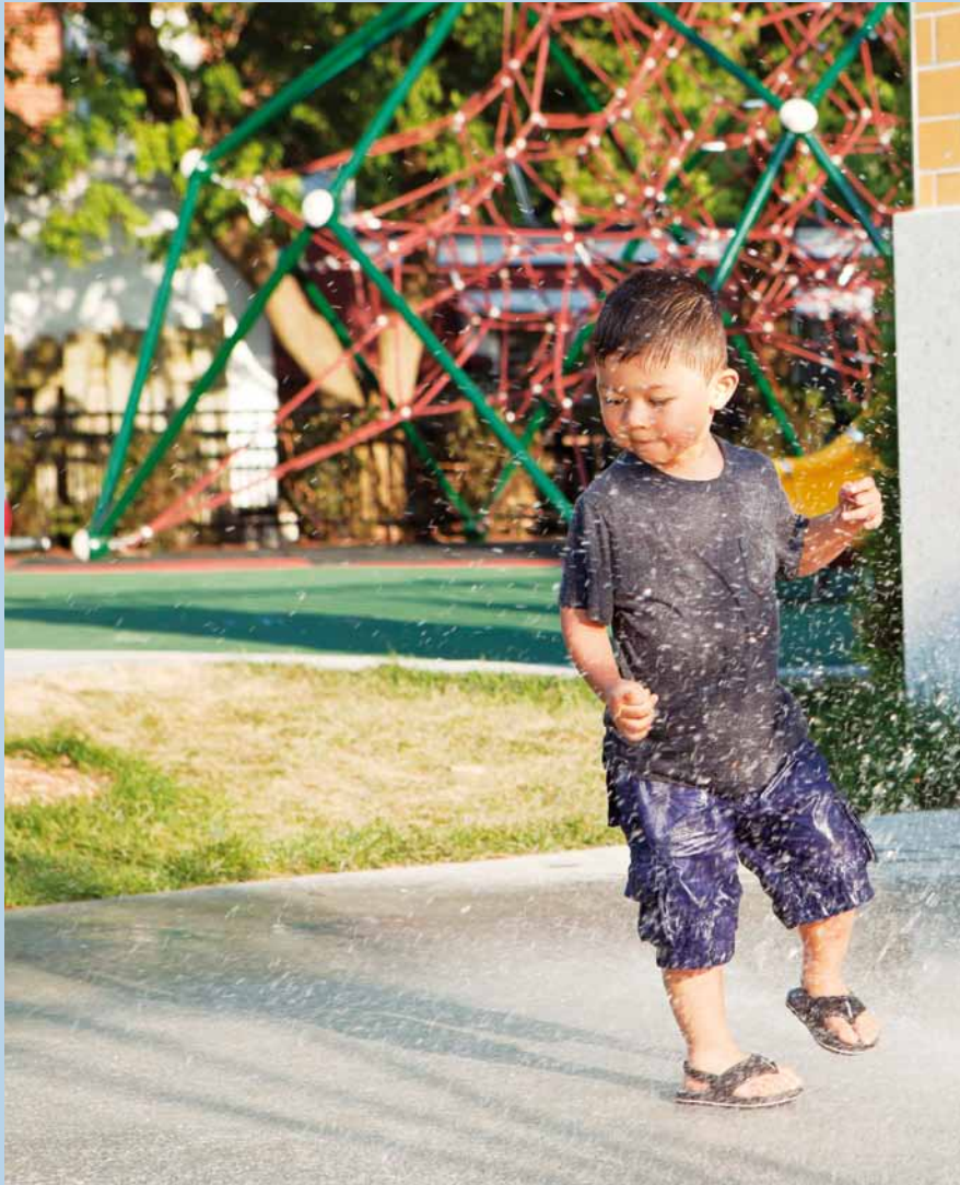
Les nouveaux modules de jeu et les jets d'eau du parc ont fait le bonheur des enfants cet été.

La construction de ce poste de ventilation du métro vise à assurer le confort de la clientèle ainsi que la ventilation d'urgence en cas d'incendie, tout en fournissant une voie d'évacuation sûre aux usagers du métro et un accès sécuritaire aux pompiers.