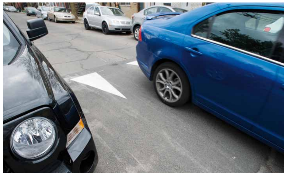
Des dos d'âne seront installés pour diminuer la vitesse des véhicules dans les rues entourant six autres parcs où jouent les enfants.

Rappelons que l'arrondissement investit un million de dollars cette année afin d'améliorer la sécurité du quartier et des piétons et de ralentir la circulation automobile. Il poursuit ainsi son programme d'interventions, en cours depuis quelques années.