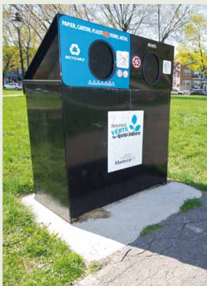
Il est maintenant possible de recycler dans plus de rues commerciales et de parcs.

Déjà, les parcs Père-Marquette, Rosemont et Sainte-Bernadette bénéficient de ce type d'îlots.