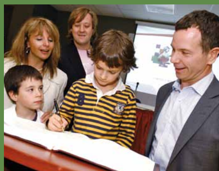
De jeunes ambassadeurs de l'arrondissement aux Jeux de Montréal signent le Livre d'or.