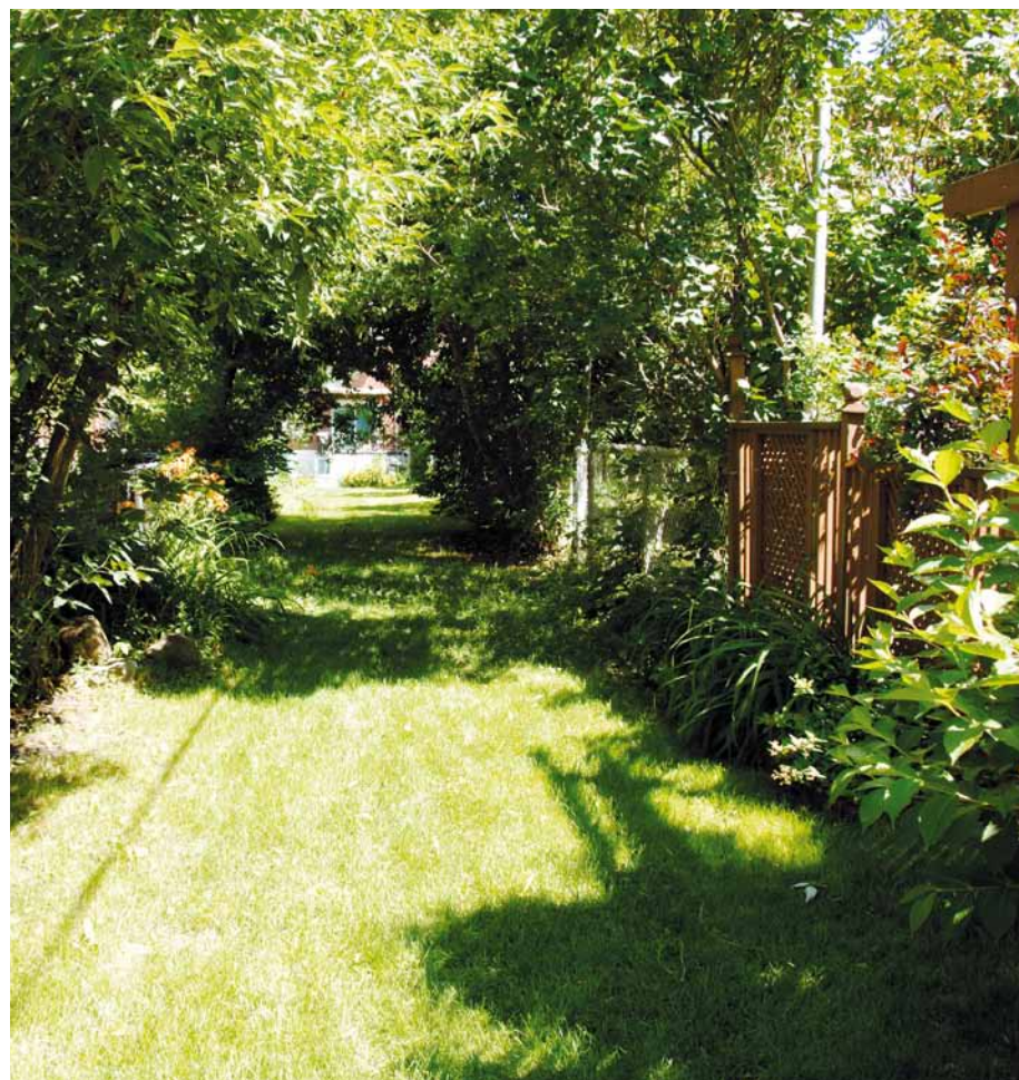
De plus en plus de jolies ruelles vertes seront aménagées dans l'arrondissement.

Bien décidé à encourager le développement des ruelles vertes, l'arrondissement a octroyé une contribution financière de 50 000 $ à la Société de développement environnemental de Rosemont afin de soutenir les comités de citoyens intéressés à verdir leur quartier.