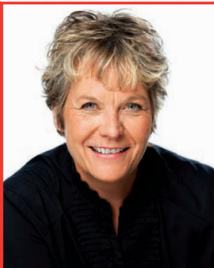
Chantal Rouleau Mairesse de l'arrondissement