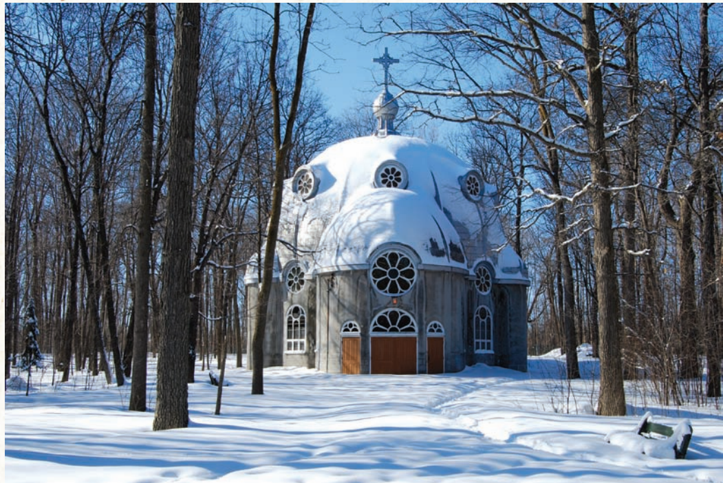
Monique Larouche, gagnante du concours de photo Le patrimoine du quartier dans l'objectif de ma caméra .

La médiation culturelle vise à établir un contact privilégié entre des artistes professionnels et des citoyens montréalais afin de renforcer la participation citoyenne à la vie culturelle de leur quartier. Jusqu'à maintenant, 32 grands projets de médiation culturelle ont eu lieu. En 2012, 3 projets de médiation culturelle ont été réalisés et ont permis à plus de 3 000 personnes de vivre une expérience unique de rencontres et d'échanges avec des artistes professionnels.