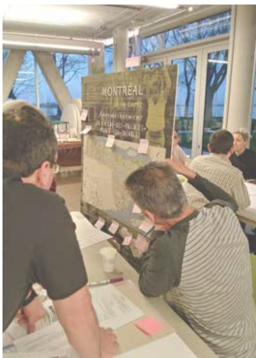
Atelier de travail au cours d'une des consultations publiques

En 2018, l'ÉcoPAP a été responsable de piloter les travaux réalisés par le comité de coordination en agriculture urbaine. L'ÉcoPAP s'est également chargé d'administrer un sondage (diffusé sur le web) et d'animer deux consultations publiques réalisées dans chacun des quartiers, pour un total de 644 citoyens consultés. Ce travail a permis d'obtenir leur opinion et connaître les freins à la pratique. Il a également débuté un recensement des initiatives en agriculture urbaine sur le territoire. Les services de Vivre en Ville ont été sollicités pour mener à bien la démarche de consultation.