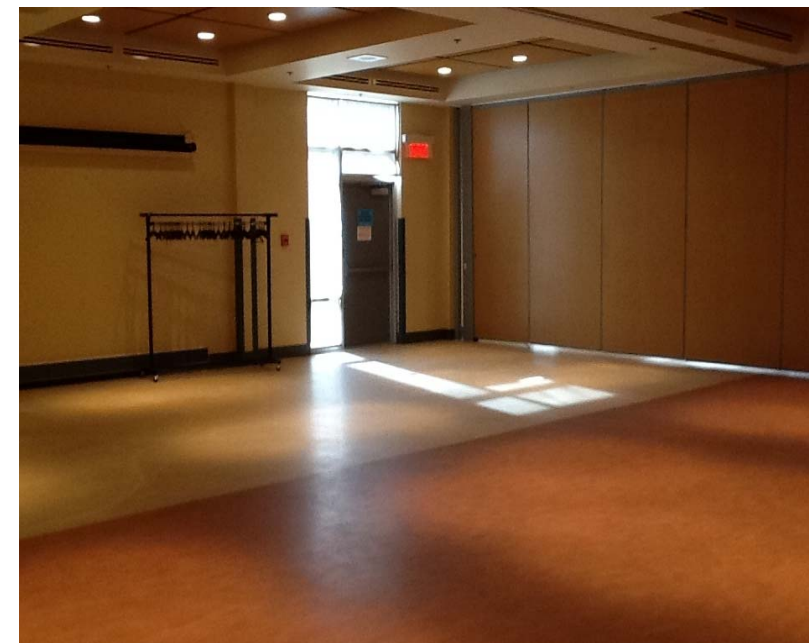
Salle 2-3 / mur accordéon