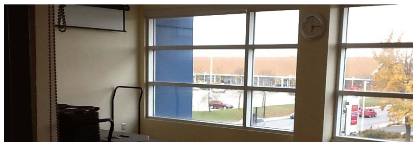
Salle de conférence