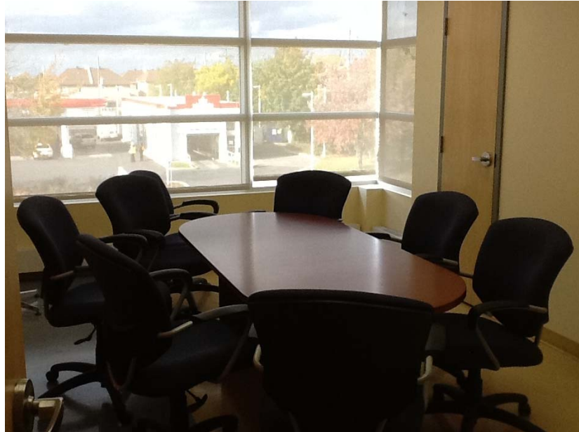
Salle de développement social