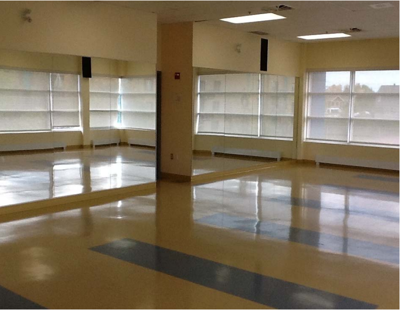
Salle de danse