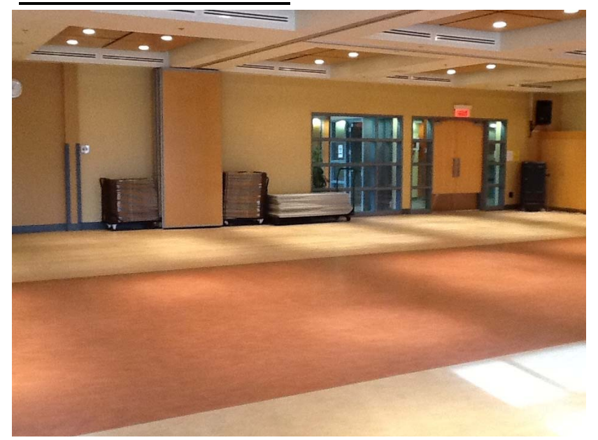
Salle 1-2-3-4 / mur Nord