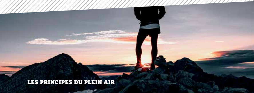
LES PRINCIPES DU PLEIN AIR