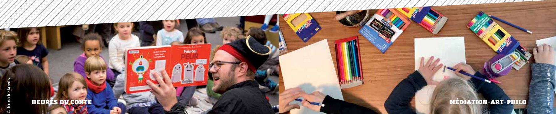
HEURES DU CONTE