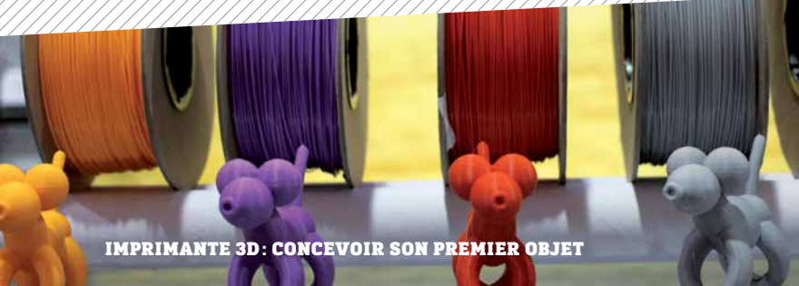
IMPRIMANTE 3D: CONCEVOIR SON PREMIER OBJET