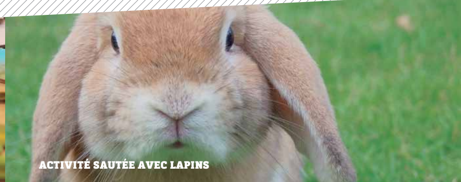
ACTIVITÉ SAUTÉE AVEC LAPINS