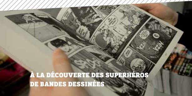
À LA DÉCOUVERTE DES SUPERHÉROS DE BANDES DESSINÉES