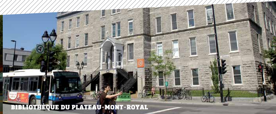
BIBLIOTHÈQUE DU PLATEAU-MONT-ROYAL