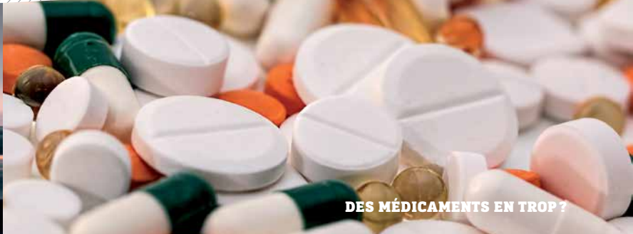
DES MÉDICAMENTS EN TROP ?