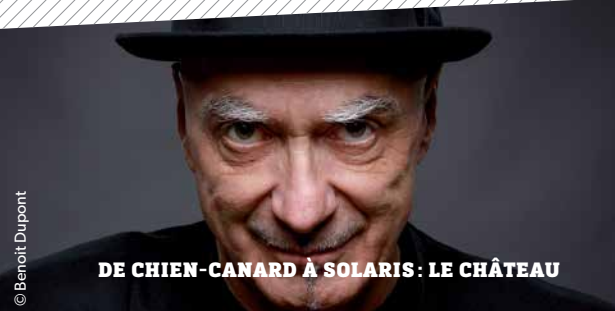
DE CHIEN-CANARD À SOLARIS: LE CHÂTEAU