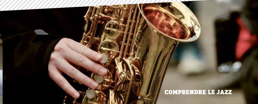
COMPRENDRE LE JAZZ