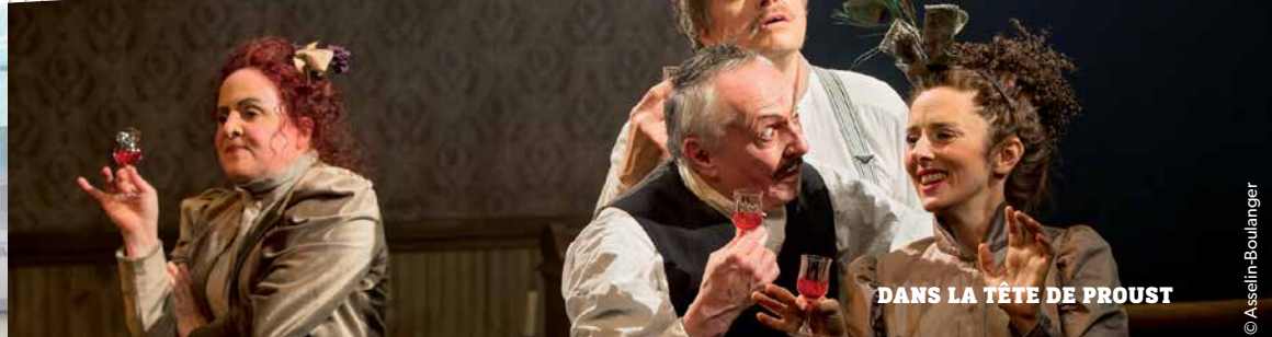
DANS LA TÊTE DE PROUST