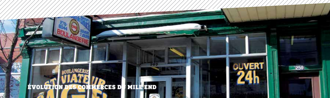
ÉVOLUTION DES COMMERCES DU MILE END