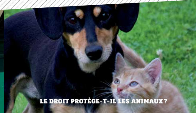
LE DROIT PROTÈGE-T-IL LES ANIMAUX ?