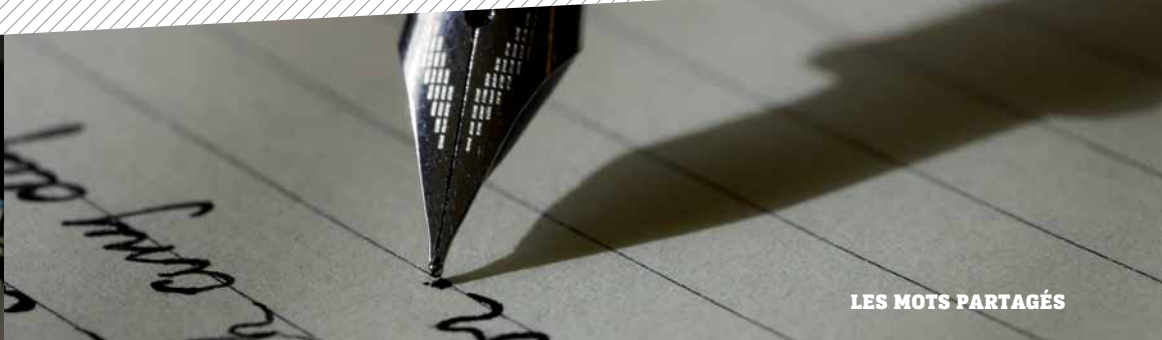
LES MOTS PARTAGÉS