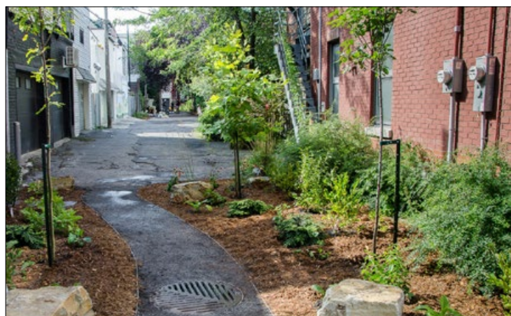
Ruelle Modigliani.