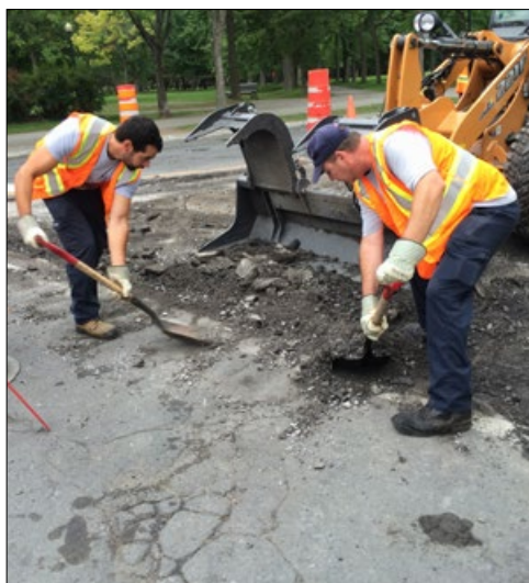
Une équipe de la voirie à l'œuvre