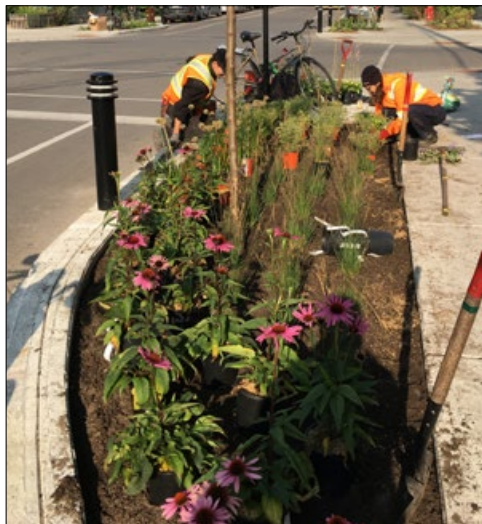
Plantations dans une saillie de trottoir