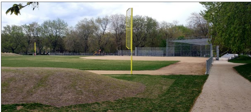
Terrain de baseball du parc Laurier

De plus, 758 000 $ financés par la ville centre, afin de réduire le déficit d'entretien des réseaux d'aqueduc et d'égout.