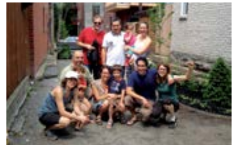
Ruelle Rachel, Gauthier, Bordeaux, Dorion

Si votre projet est retenu, le comité vert et tous les résidants-riverains seront invités par l'arrondissement à une rencontre d'information dans la ruelle. Le responsable de l'arrondissement explorera avec l'ensemble des riverains présents le concept préliminaire. Des changements pourraient être proposés. Si un ou des résidants sont contre le projet, c'est à ce stade-ci qu'ils doivent se prononcer. Ils devront prouver que plus de 50 % des résidants-riverains sont contre le projet pour le remettre en question.