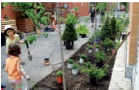
Plantation ruelle piscine Lévesque