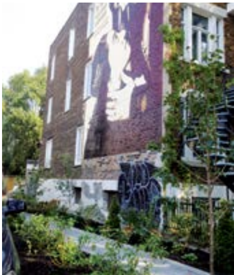
Ruelle Masson, Laurier, Érables, De Lorimier