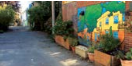
Ruelle verte Saint-Joseph, Gilford, Chambord et De Brébeuf