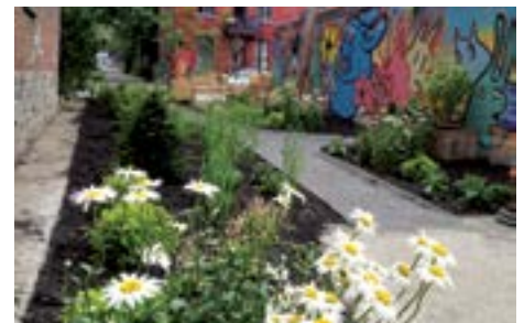
Ruelle Villeneuve, Mont-Royal, Saint-Urbain, Esplanade