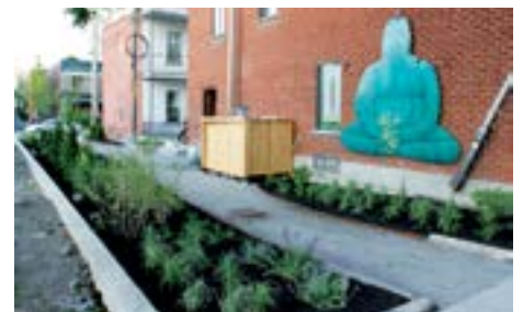
Ruelle Mont-Royal, Marie-Anne, Boyer, Mentana