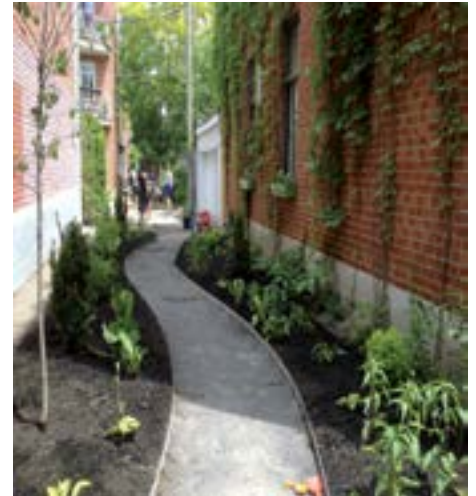
Ruelle Gilford, De Bienville, St-Hubert, Resther

Arrondissement du Plateau-Mont-Royal 201, avenue Laurier Est, 5 e étage Montréal (Québec) H2T 3E6 verdissementplateau@ville.montreal.qc.ca