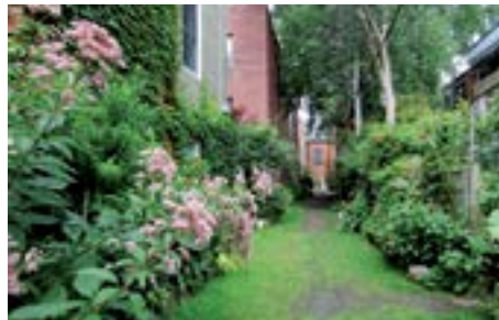
Ruelle Des Pins, Square-Saint-Louis, Drolet, Henri-Julien

Même si le projet est financé par une source externe, il doit être soumis à l'arrondissement qui évaluera la faisabilité du projet et émettra les autorisations et permis nécessaires.