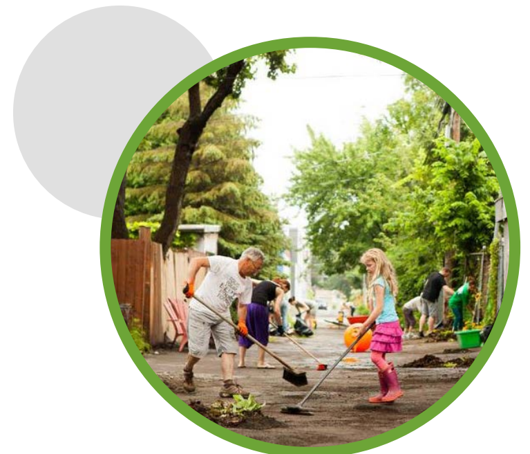
Ruelle verte dans l'arrondissement de Mercier-Hochelaga-Maisonneuve

EN PLUS DE SOUTENIR FINANCIÈREMENT LES PROJETS DE RUELLES VERTES, L'ARRONDISSEMENT DE MONTRÉAL-NORD A MANDATÉ UN ORGANISME QUI ACCOMPAGNERA LES COMITÉS DE RIVERAINS DANS LA RÉALISATION DE LEUR PROJET!