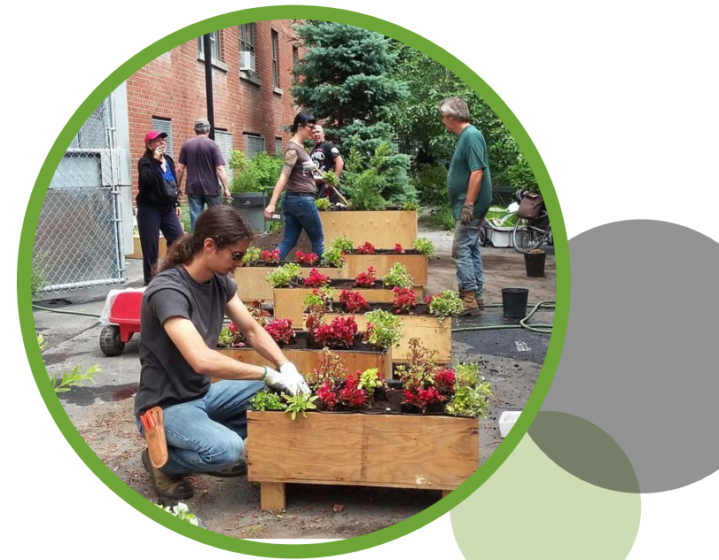
Ruelle verte Saint-Jacques, arrondissement Le Sud-Ouest

À Montréal-Nord, il y a relativement peu de ruelles. Toutefois, plus d'une cinquantaine de celles-ci pourraient faire l'objet d'un projet de ruelle verte !