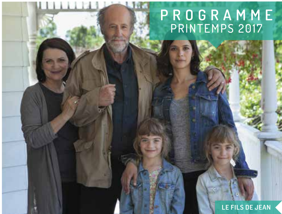
LE FILS DE JEAN