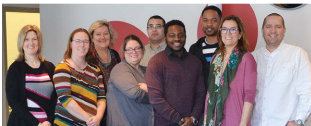
Des agents du bureau Accès Montréal de CDN-NDG qui gèrent le service 311, de 8 h 30 à 17 h, du lundi au vendredi.

Connaissez-vous les services offerts par l'arrondissement? Le service 311 est un service téléphonique permettant aux citoyens de communiquer directement avec l'arrondissement de CDN-NDG. Vous n'avez qu'à composer le 311.