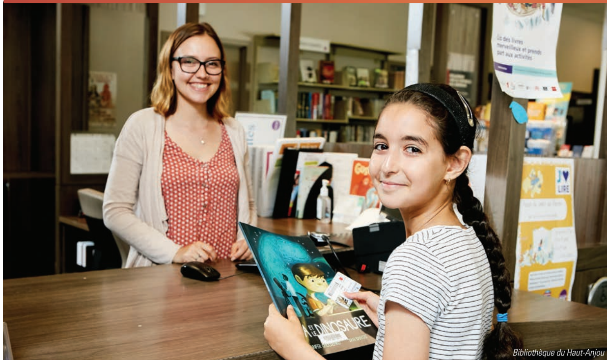
Bibliothèque du Haut-Anjou