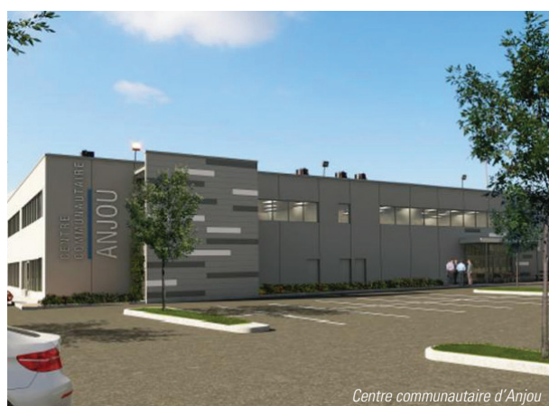
Centre communautaire d'Anjou

Il ne passe pas inaperçu, cet autobus bleu qui sillonne nos rues. C'est un service unique qui est proposé aux organismes dans le cadre de leurs activités de déplacement sur le territoire d'Anjou ainsi qu'à l'extérieur, dans un rayon de 100 kilomètres. Il est également utilisé par les personnes participant aux activités offertes par l'arrondissement.