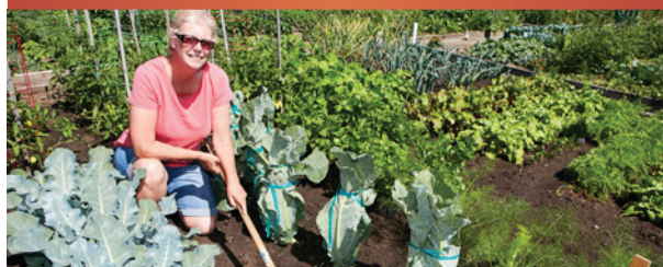
Jardin communautaire Roi-René