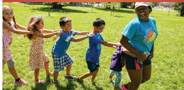
Camp de jour Les Ateliers-Soleil