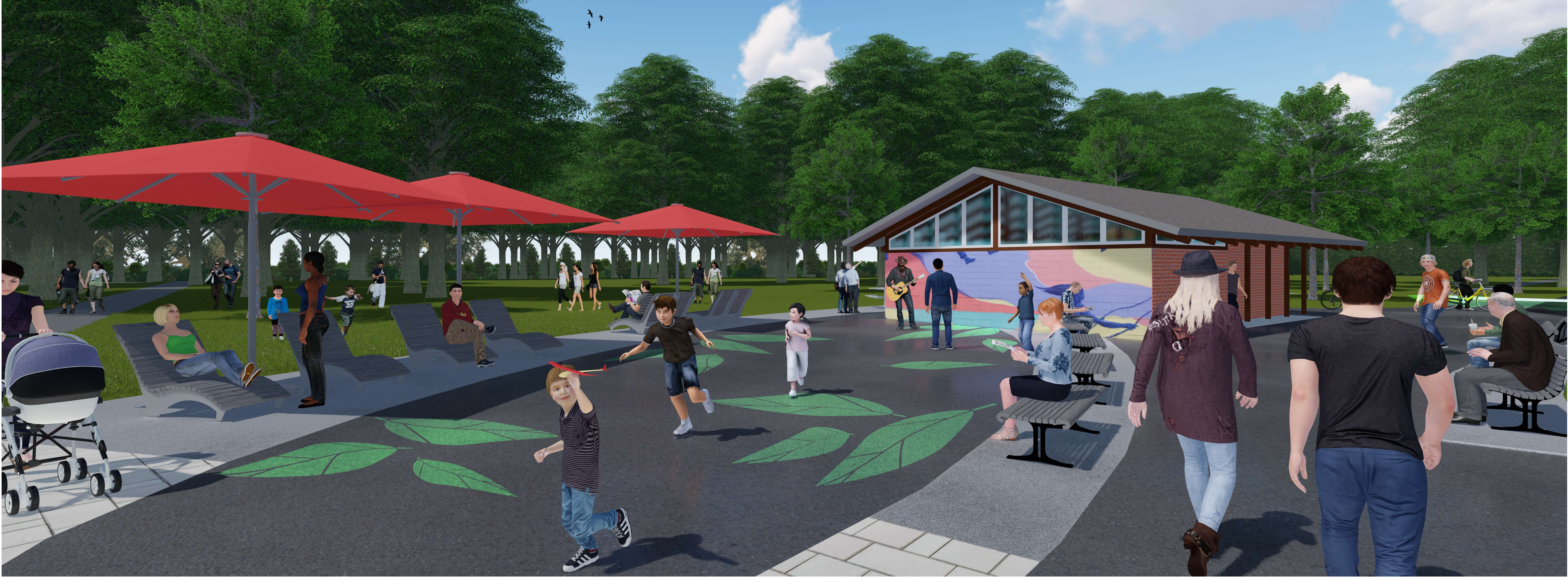
UN ESPACE RASSEMBLEUR POUR LE QUARTIER