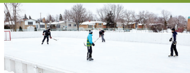
Parc de Spalding