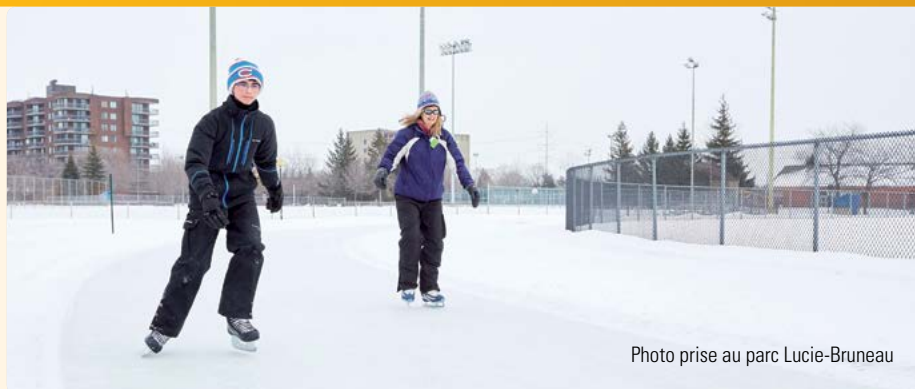
Photo prise au parc Lucie-Bruneau

Des pavillons chauffés sont aménagés dans tous les parcs et une surveillance des lieux est assurée durant les heures d'ouverture.