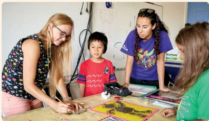
Photo prise lors des Ateliers-Soleil 2017 / Camp spécialisé en arts plastiques