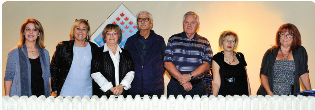
Les membres du comité d'embellissement

Les gagnants du concours ont été invités par le maire d'arrondissement à une cérémonie, le 30 septembre, à la mairie d'arrondissement. À cette occasion, un souvenir leur a été remis.